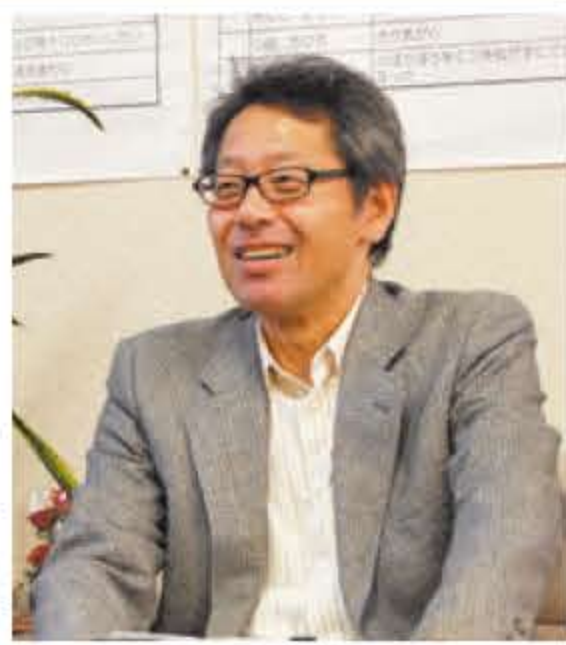
未来、国際的に活躍する子どもたちは、この弱点を克服しなければならぬ。

「存知の通り、地震と津波に襲われたときの日本人の対応は高い評価を得ました。一方、原発の対応では「日本人の価値観や意志が見えてこない」と疑問の声が聞かれました。