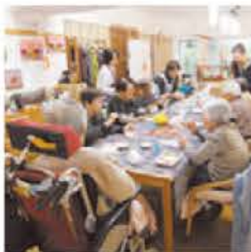
デイサービスの様子

年齢とともに体の機能が低下しても、心までもが若さを失って沈んでしまつのは、その人に合った楽しく安らげる時間がないからではないか。 「クイックモンス・ライフサポート」は、至れり尽くせりの老人ホームではなく、また決まったサービスクレジットの「喜び」や「楽しみ」を大切にしている。併設のデイサービスでは、陶芸やパステル画教室等が定期的に開かれ、好きな内容を選んで参加できる。こうした活動が入居者同士の交流も深めている。 入浴は介助付きで個入浴が可能。 ▽クイックモンス・ライフサポートII 天王寺区大道3-4-3、電話06-6775-0345 http://www.quickmonno.jp/