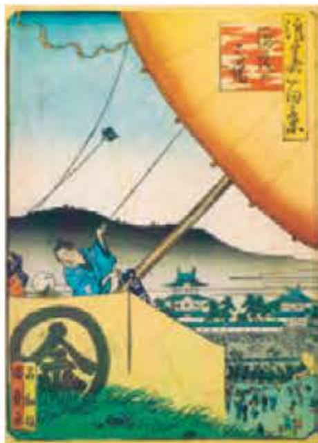
浪花百景「錦城の馬場」

この写真の絵を見て下さい。お城の建物を背景に凧揚げをしている様子が描かれています。このお城は、そしてこの凧揚げをしてる場所はどこのお城でしょうか？その答えはこの絵の右肩に書いてあります。「錦城の馬場」です。「錦城」は「金城」ともいい、いつまでも輝きを失わず、朽ちることのないという意味合いを含めた大坂城に対する美称です。