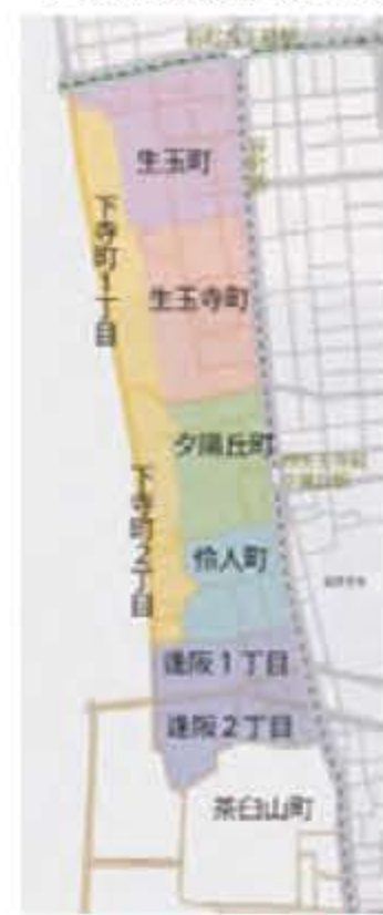
夕陽丘町丁区分図

まちにはそれぞれに多様な課題・問題や市民から寄せられるニーズがありますが、前項で見た緑のまちづくり策はその一つ。