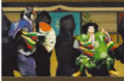
義経千本桜(上)、花鏡四季寿(下)

1月3日(土)・26日(月)、国立文楽劇場で初春文楽公演が開催されます。新年の始まりにふさわしい華やかで見応えのある演目がそろいます。初日の第一部開演前、1階正面玄関前では文楽人形による鏡開きが行われます。7日(水)まで、幕あいに抽選で手拭いのプレゼントがあります。劇場内にはえとひ文字を書いた大風が飾られ、華やかな雰囲気です。初日(土)は休演。観劇料は1等席一般6000円・学生4200円、2等席2400円。▽国立文楽劇場(中央区日本橋1-12-10、チケットの電話予約は0570-07-990)