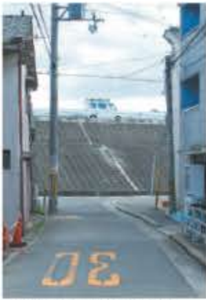
ただ、分断されたとはいえず、道の筋の場所を確認してみたい気持ちはあります。何より対岸に残るはずの街道の様子に気がなりました。

野里の渡しを過ぎて柏里へ入りました。梅田街道はここから東南方向へと道をとりまわります。比較的新しい住宅の間を歩いていくと、淀川(新淀川)の高い堤防が目の前に現れました。野里の渡しで越えた旧中津川の堤防跡とは比べものにならない巨大な堤防です。淀川自体は古い歴史をもつ川ですが、都島区の毛馬より下流部分の流路は1909年に竣工したものです。大雨が降るとしばしば洪水を起した流路を大きく改め、13年をかけてこの部分ではまったく新しい流路が造られたのです。