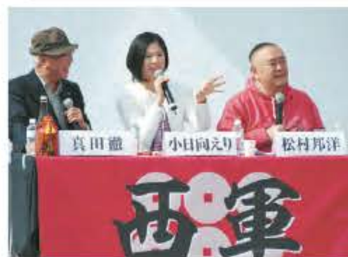
「天王寺 真田幸村博」ファイナルイベント 2万5000人が来場