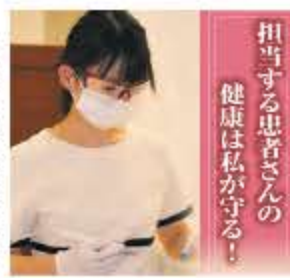
担当する患者さんの健康は私が守る!

むしろ歯や歯周病になつてから治療をするとしても元通りに再生する訳ではないので、治療しない方がいいようにしっかりと予防することが重要となります。そこで大切な役割を担っているのが歯科衛生士。患者のお口の健康を守る彼女たちに、歯科衛生士になつたきっかけや仕事の魅力について話をうかがいました。