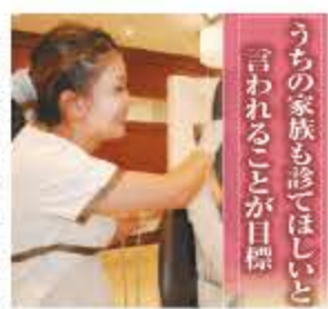
うちの家族も診てほしいと言われることが目標

歯並びが悪く、歯科医院に通ううちに歯科衛生士の仕事に興味を抱き、この道に進みました。私たち衛生士は治療終了後の良い状態をその後ずっと維持するという責任重大な役割を担っています。衛生士の経験年数によって治療後の患者様の予後の状態が違ふということがないよう、特に最初の数年は技術、