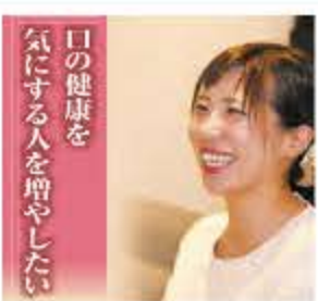
口の健康を気にする人を増やしたい

小さなお子様からご年配の方まで幅広い年代の方と深く関わるお仕事です。たくさん笑顔が見られたり、「ありがとう」の言葉を頂いたりしたとき、この上ない喜びを感じます。私は「おいしく食事する」「笑顔で話す」といった豊かな暮らしをサポートできる歯科衛生士の仕事にひかれ、また、この仕事は医療ということで景気に左右されず安定した職種であり、子育てなどで職場を離れても復職しやすいという意味で女性には向いている仕事だと思っています。