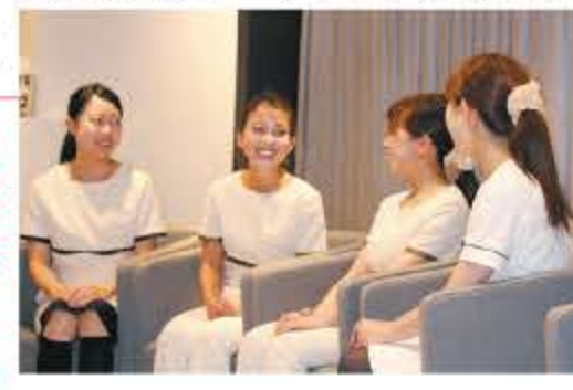
取材協力:藤村歯科クリニック(大阪市天王寺区)

を磨きたいとたくさん勉強し、歯垢や歯石の除去などの練習も重ねました。そして学んだことや身に付けたことを患者様にしっかりと伝え、することに注力しました。歯磨き指導やお口に関する様々な悩みをお聞きしながら、患者様が豊かな生活を送れるようお手伝いさせていただく。そんなところにこの仕事の魅力を感じます。