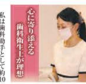
心に寄り添える歯科衛生士が理想

日本では服やメイクはきちんとしているのに歯のことがあまり気にしていない方が多いですね。今後は、一人でも多くの方に口内を健康に保つことの大切さを感じてもらえるように、またそれを伝えていけるようなアプローチを積極的にしていきたいです。