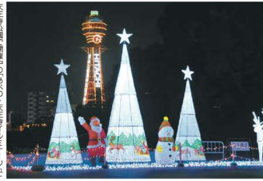
天王寺公園で開催中の「あべの・天王寺イルミネーション」