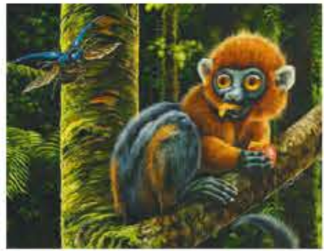
イーターイラスト