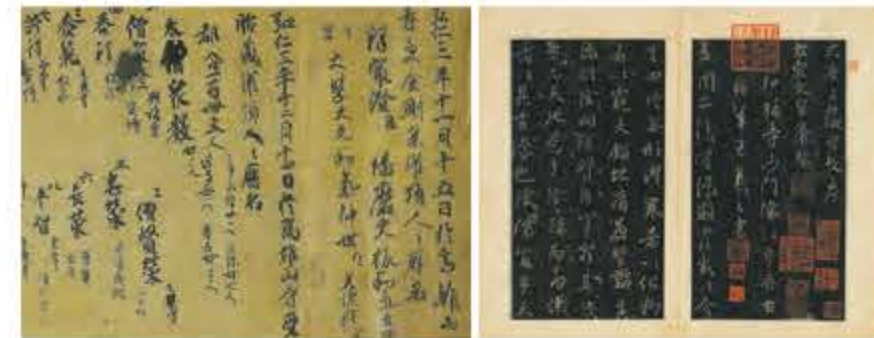
①王羲之「集王聖教序(しゅうおうしょうぎょうじょ)」唐・咸亨三年(672年)兵庫・黒川古文化研究所蔵 ②国宝 空海「灌頂歴名(かんじょうれきめい)」平安・弘仁三年(812年)京都・神護寺蔵

日中の名筆を一堂に集めた特別展「王羲之から空海へ―日中の名筆 漢字とかなの競演―」が4月12日(火)～5月22日(日)、大阪市立美術館