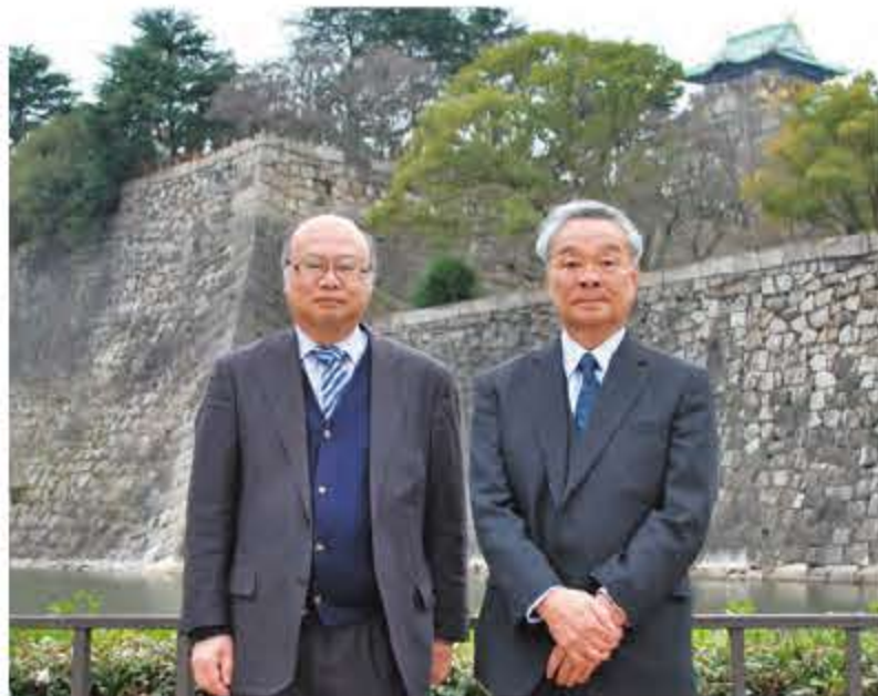
④大阪城天守閣東側、石垣の前で ⑤暮れに写された本丸東側の石垣と櫓・多聞櫓