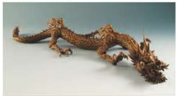
①冬瓜大香炉(村上盛之作・清水三年坂美術館蔵) ②龍自在置物(穠山竹林斎作・清水三年坂美術館蔵)

た作品を通して、近代工芸の知られざる魅力を紹介いたします。6月20日まで。大人1000円、高校・大学生700円。中学生以下、障がい者手帳を持参の人、大阪市在住の65歳以上(要証明)は無料。午前9時30分から午後5時(金曜は8時)まで。火曜日休館(5月3日は開館、5月6日は休室)。