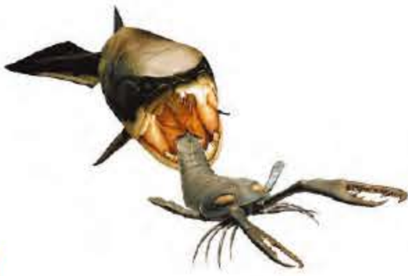
ダンクルオステウスVS ウミサソリ(模型)

長類の進化について私たちにいろいろなことを教えてくれます。6月19日まで。入館料は大人1300円、高校・大学生800円。中学生以下、障がい者手帳を持参の人、(要証明)は無料。