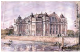
「大阪市公会堂新築設計図 透視図」(岡田信一郎案) 大阪市蔵 ※前期のみ展示(7/21～8/13)

大正14年に大阪市が面積・人口ともに日本第一位となり大都市「大大阪」が誕生しました。この時代の幕開けを告げる大阪市中公会堂の実施設計を手掛けた、大阪の都市計画を指導した片岡安。彼の仕事と都市美を描いた絵画が展示されます。