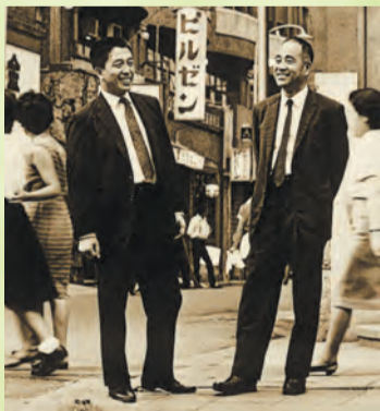
帝塚山学院小学校が生んだ二人の芥川賞作家 飯田寛夫(左)、庄野潤三(右)