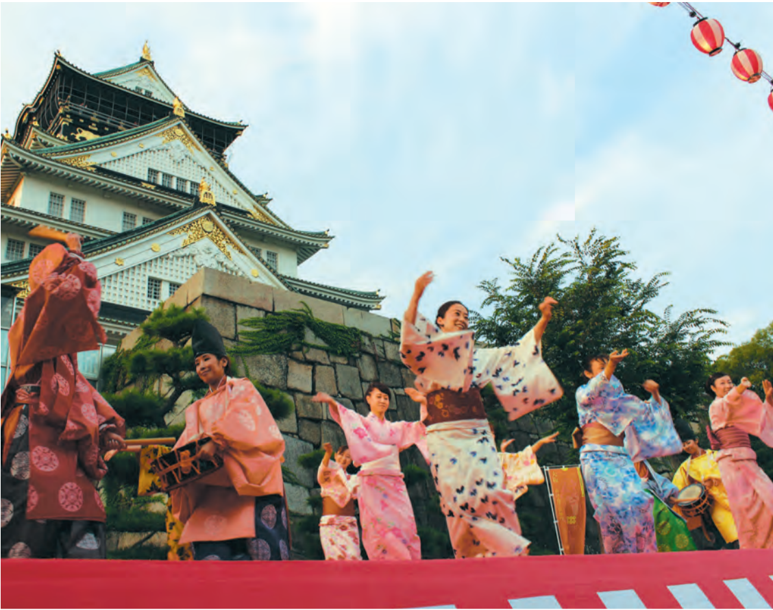
大阪城の新たな夏の風物詩として定着しつつある「豊国踊り」(詳細は9面)