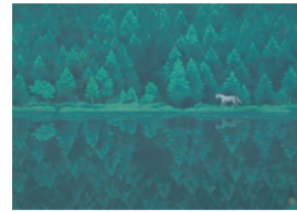
《緑響く》1982年 東山魁夷 長野県信濃美術館 東山魁夷館 額装、紙本彩色 84.0×116.0cm

代表作「残照」「道」「緑響く」など約70点の本画のほか、奈良・唐招提寺御影堂の障壁画(襖絵と床の壁面全68面)を再現展示。今後数年間、修理で見ることができなくなる御影堂の内部を、間近で眺めることができる貴重な機会です。