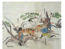
「島津虎狩絵巻」(初公開) 大阪城天守閣蔵

戦国時代の食のあれこれを、古文書や屏風絵、絵巻物など多彩な史料で紹介。『戦場の食』『空の幸』『海の幸』『川の幸』『山の幸』『野菜、フルーツ、スイーツ』『食あたり? 食べすぎ?』の6部構成で、秀吉がトラを食べた話や、おね様の食あたりのエピソードなど、当時の日常をリアルに感じられる展示です。