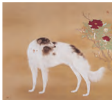
唐犬(右扇) 橋本関雪 1936年 同館蔵

大阪市立美術館所蔵・寄託の作品の中から、夏休み中の子どもたちにも楽しんでもらえるよう、近世・近代の画家たちが描いた動物たちを紹介するコレクション展。同館の所蔵品第一号、橋本関雪の「唐犬」をはじめ、古くから絵画の対象になってきた動物たちの愛らしい姿を観ることができます。