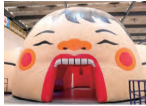
見上げるような巨大な口

子どもたちにとって興味津々な「からだ」から得られるキタないモノをテーマに、体の「不思議さ」を学ぶ体験型イベント。今回は関西初上陸の全長40mの巨大人体が登場。大きな体の中を探検しながら「キタないモノ」の大切な役割を学べます。