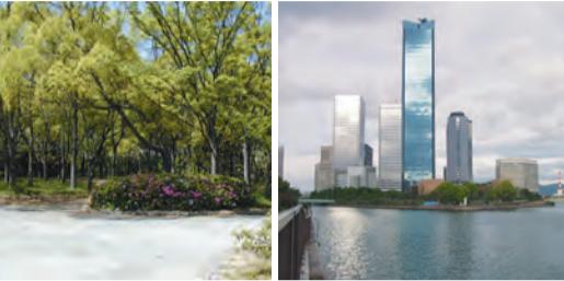
④徳川時代大坂城模型(天守閣3階にて展示)の内、本丸御殿 ⑤京橋口定番屋敷跡 ⑥今の大阪ビジネスパーク内にあった砲硝場が大爆発を起こした

9日の朝、長州藩が大坂城近くに陣し城内に砲撃を始めた。多くの人は大手前の小高い丘(今の大阪府庁、大阪府警本部付近)に集まり、遠巻きに大坂城の最期を見届けました。『近來年代記』という史料には「ああ惜しむべき名城なれど、一時の煙と煙にけり」と書かれています。