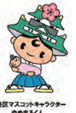
中央区マスコットキャラクター ゆめまるくん

問合せ 中央区役所保健福祉課(保育担当) 4階43番 電話06・6267・9865