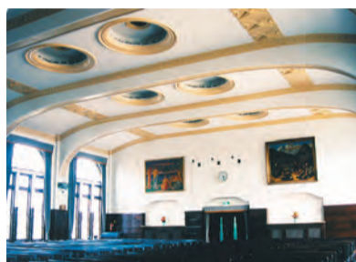
贅を尽くした校舎の内装 ㊦講堂 ㊧照明

日本で初めて本格ウスキーづくりに尽力した竹鶴政孝、リタ夫妻は1920（大正9）年、スコットランドから帰国後、帝塚山の借家に住みました。その間リタ夫人は帝塚山学院小学校で英語を教えています。学院の記録には、22年9月20日から24年12月31日まで教員として在籍したとあります。