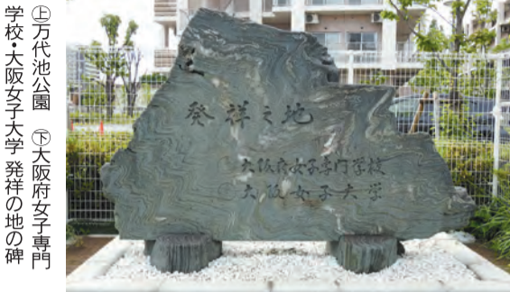
④万代池公園 ⑤大阪府女子専門学校・大阪女子大学 養祥の地の碑