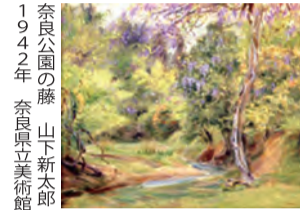
奈良公園の藤 山下新太郎 1942年 奈良県立美術館蔵

明治時代の幕開けから今年で150年を迎える。明治を記念した企画展。明治時代以降、本格的に日本に定着した「洋画」が奈良でどう展開されていったかを、奈良ゆかりの作家の作品や、奈良を描いた作品から探ります。