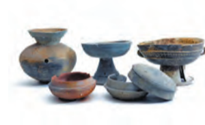
大阪府陶器窯跡群出土品

堺市内に残る、国内有数の古代の窯跡遺跡「陶器窯跡群」から見つかった器や、生産に関連する道具などを展示。古代から堺が国際的に活躍した一面や、先進技術が定着・発展した過程を知ることができます。