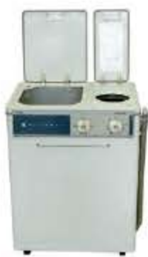
入館料:300円(企画展のみ)

懐かしい昭和の家電を紹介する企画展「お正月だよ!今年もよろしく、昭和レトロ家電—マスタコレクション展—」が1月3日(日)から始まります。 昭和30~40年代によく使われていた洗濯機や電気ストーブなどの家電や、当時の最先端技術とアイデアで開発された珍しい家電を展示。家電の内側が見られる珍しい展示のほか、食品や薬など暮らしに密着したポスター約40点を公開します。