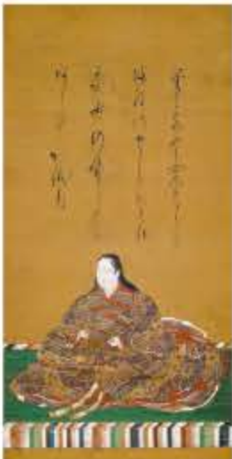
「伝 定殿画像」 桃山-江戸時代・17世紀 (奈良県立美術館蔵)

奈良県立美術館で1月23日から、「真田丸」関連企画展「蕭白・松園…日本美術の輝き」を開催します。武者絵から刀剣、近代の名品まで「真田丸」やその歴史が話題を集める昨今、武士ものの心づいた姿や日本刀が注目されています。同展では、このような旬な話題を取り入れ、日本美術の素晴らしさを紹介します。 ▽奈良県立美術館 奈良市登大路町10-6、電話0742・23・3968 観覧料は一般400円、高校・大学生250円、小・中学生150円。65歳以上、障がい者手帳を持参の人は無料(要証明)。