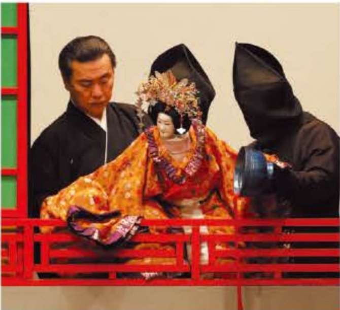
第2部「国性爺合戦」(紅流しより獅子が城の段)