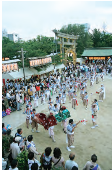
獅子舞 (昨年の様子)

「難波の大社」として、毎年7月11・12日に人々に崇敬される生國魂神社は大阪の夏祭りの魁(さき)、「いくたま夏祭」(い)といわれ、本格的な