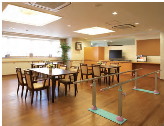
ベルパーージュ大阪上本町の食堂兼機能訓練室

高齢者に24時間安心で快適な暮らしを ベルパーージュ大阪上本町、桃坂コンフォガーデンに 「ベルパーージュ大阪上本町」は関西電力グループの「かんでんジョイライフ」が運営する介護付き有料老人ホーム。上町台地の新しいまちづくりプロジェクトとして開発が進む桃坂コンフォガーデン内に今春オープンしました。 「ベルパーージュ大阪上本町」はカードキーによる万全のセキュリティシステム、専任介護スタッフによる24時間対応の緊急コールシステム、手すりの設置や段差の解消によるバリアフリーデザインなどの工夫が館内随所に施されており、体調不良時の生活支援や