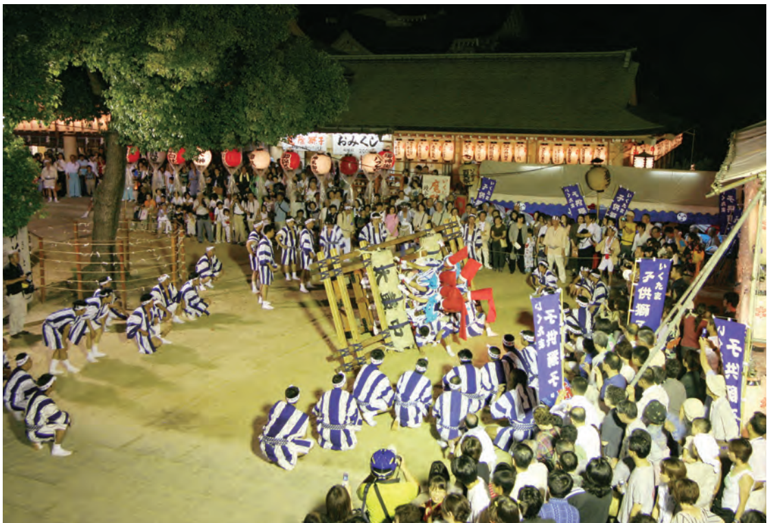
「いくたま夏祭り」の山場、枕太鼓のお練り(昨年の風景)。