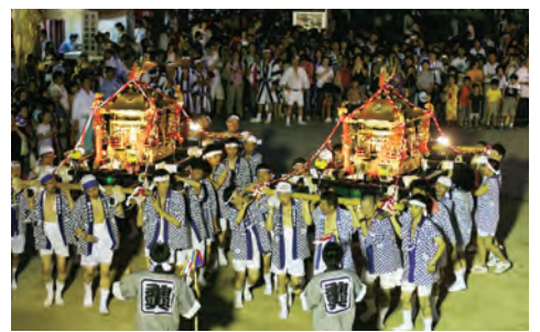
金・銀みこし (昨年の様子)

延々と連なる渡御行列(お渡りの列)は先陣が城内に入城したころ、後陣の人馬はまだ御本社でその宮出を待ち構えていたといわれます。その後戦火により御鳳