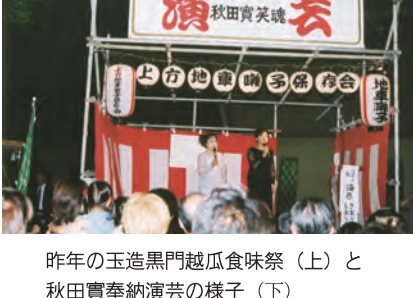
昨年の玉造黒門越瓜食味祭(上)と秋田實奉納演芸の様子(下)

玉造稲荷神社は7月15日、夏まつりを開催。宵宮の15日、同社が普及を支援するにわ伝統野菜「玉造黒門越瓜(たまつくりくろもんしろり)」の食味祭を開催。