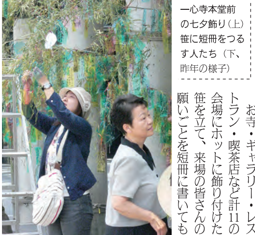
一心寺本堂前の七夕飾り(上) 笹に短冊をつるす人たち(下、昨年の様子)

お寺・ギャラリー・レストラン・喫茶店など計11の会場にホットに飾り付けた笹を立て、来場の方々の願いごとを短冊に書いても