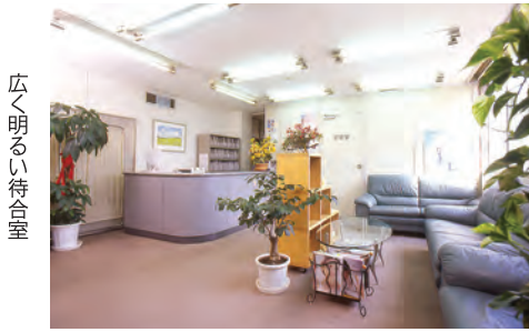
広く明るい待合室

汗をかきやすく、体臭が気になる季節になりました。ワキガや多汗症の人は憂うつになりますね。地下鉄谷町9丁目駅すぐ、皮膚