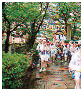
子どもみこし (昨年の様子)

み夏の邪気をはらう獅子頭をついた笹(ささ)が授与されます。神にぎわいとして黒門市場と空堀地区より「子どもみこし」が渡御。境内の仮設舞台ではさまざまな演芸が奉納され、昨今では、桂文枝一門による落語会や、子供絵画の展示など、時代に即したさまざまなイベントが開催されます。絵馬殿