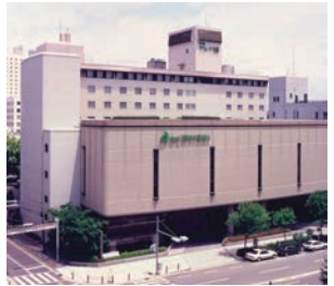
ホテルアウィーナ大阪

ホテルアウィーナ大阪 は、レストラン・結核式 場・宴会場・貸会議室 を完備した、公立学校共 済組合が運営するホテル です。月ごとや季節に応 じたイベントを多く開催 し、バラエティーに富ん