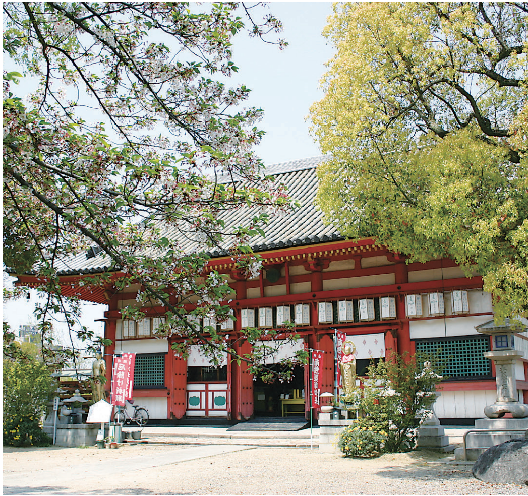
上町台地の季節の風景を写真で紹介。春の日差しを受けて鮮やかな色彩を見せる愛染堂の金堂(右)は593年聖徳太子によって創建された大阪府の指定文化財です。多宝塔(左上)は大阪市最古の建造物として国の重要文化財になっています(勝鬘院愛染堂:天王寺区上本町)