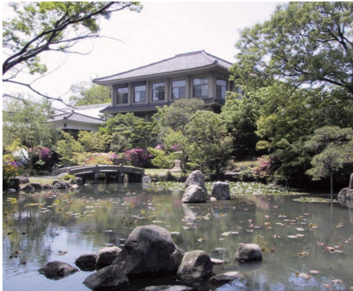
新緑が美しい本坊庭園

時30分まで)、無休(法要時など休園あり)、大人300円、高校・大学生200円。 四天王寺は593年聖徳太子によって日本仏法