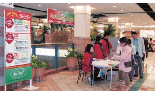
「あべちか」こと、アベノ橋地下センター商店街振興組合では、5月中旬の毎週月曜日、お買い上げ金額に応じて抽選で、キャッシュバックや豪華景品の当たる「ハッピーマンデー」を開催しています。ほかプレゼントもあり。お買い物はお得な月曜日がおススメ。