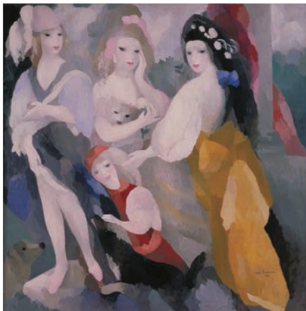
マリー・ローランサン「プリンセス達」1928年

派のポッチョーニ、形而上絵画のデ・キリコ、超現実主義のエルンスト、ダリ、マグリットら著名