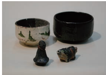
「軟質施釉器」とよばれる焼き物

また、関西の代表的な焼き物である京焼や樂焼との技術的つながりについて、伝世作品と現在に残る技術とを比較しながら考えていきます。