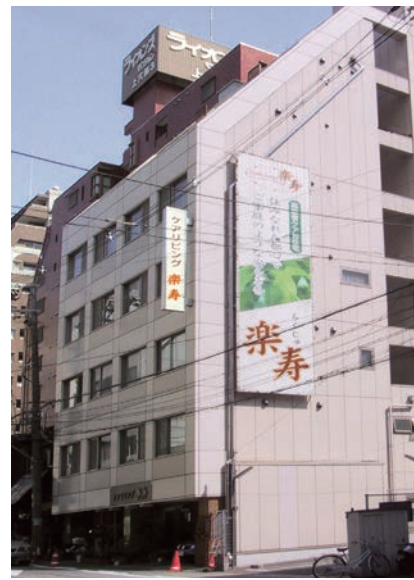
ケアリビング楽寿外観