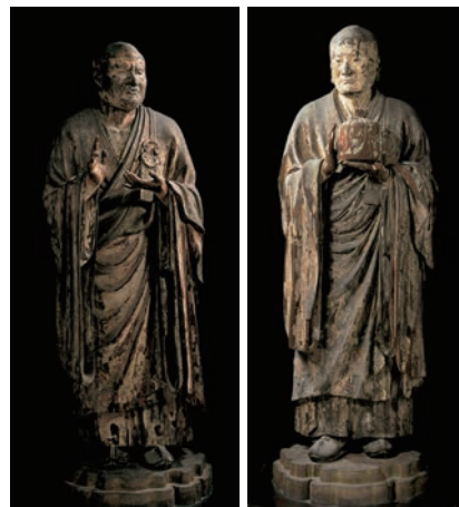
国宝「無著菩薩立像(むじやくぼさつりつぞう)」、右 国宝「世親菩薩立像(せしんぼさつりつぞう)」、左

▽大阪市立美術館 天王寺区茶臼山町1-82、電話06-4869-8600。定休日は月曜日。