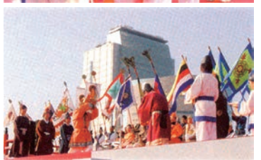
色とりどりの衣装が楽しみ

月6日に開催されます。難波宮を舞台に古代衣装を着たパレード、交流儀式を行います。