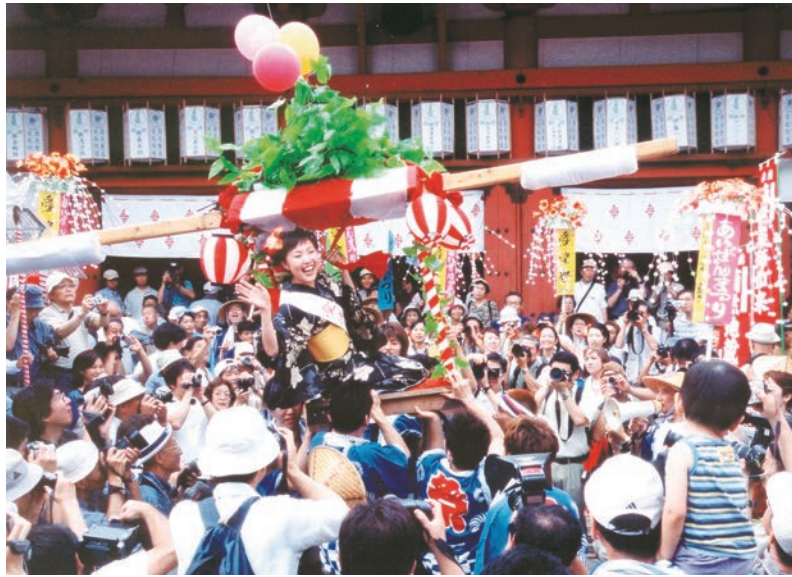
愛染祭りを盛り上げる愛染娘は大人気

祭りの華「愛染娘」を募集 「あいすみません」の語呂に合せて、最初が愛染祭の「あい」、最後が住吉祭の「すみ」というわけです。