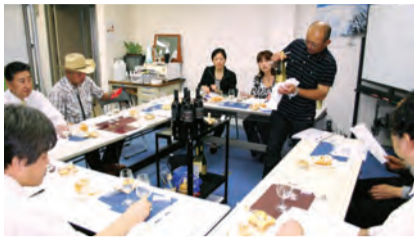
オフィス・バルでは多彩なセミナーなども開催して交流を図っています

オフィス・バル(中土井社会保険労務士事務所)の事務所理念は「ここで働けて良かったな...」と思える会社づくりのお手伝い。企業の労務に関するあらゆる問題を解決します。