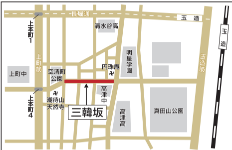
三韓坂を見下ろす円珠庵のある餅差町交差点付近(上)と周辺地図

オフィス・バル(中土井社会保険労務士事務所)の事務所理念は「ここで働けて良かったな...」と思える会社づくりのお手伝い。企業の労務に関するあらゆる問題を解決します。