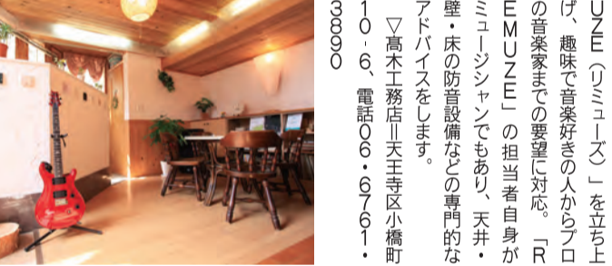
音楽で癒やされる空間「サウンドリフォーム」

実際の場所は分かりません。でもきつと分かる日が来ると思えます。だつて、難波宮でもその姿を現したのははるか昔の時を経てつい最近のことなのです。