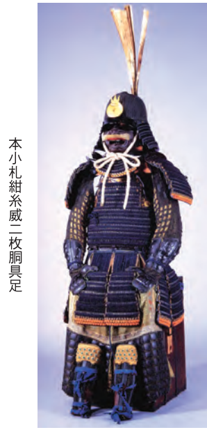
本小札紺糸威二枚胴具足

大阪市立美術館は11月1日-12月14日、特別展「国宝三井寺展」を開催。近畿屈指の名高い寺、三井寺(大津市、正式名称は長等山園城寺)が所蔵する秘仏や絵画を中心に、国宝・重要文化財を含む約190件の名宝を紹介いたします。三井寺は7世紀に創建され、天台密教の神髄を伝えた智証大師円珍が9世紀に天台寺院として中興した寺。今年1150年にあたり、これを記念して同展を開催するもの。修行中の円珍の前に出現した金色の不動を描かせたという「国宝・黄不動尊」や、円珍と三井寺の守護神像「国宝・新羅明神座像」、円珍の彫像「国宝・御骨大師・中尊大師」など、普段は拝観できない円珍ゆかりの秘仏を公開。狩野永徳の長男で御用絵師・狩野光信が境内にある国宝・勸学院に描いた華麗な障壁画(ふすま絵)も展示します。観覧料は一般1200円(前売り・団体1000円)、高校・大学生900円(同700円)。11月10日締め切り。