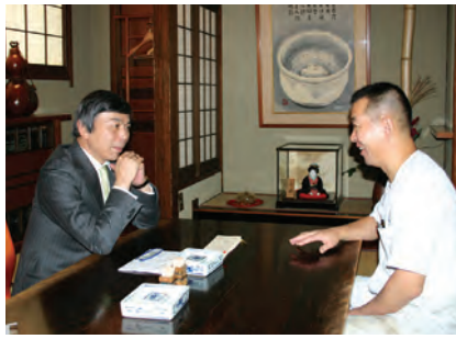
上町筋に面した割烹「とんぼ」で橋本店主(右)と対談