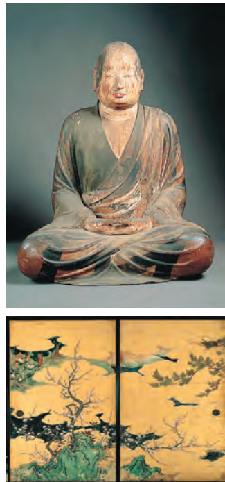
国宝「智証大師座像」(上) 重文「勸学院客殿障壁画」(下)