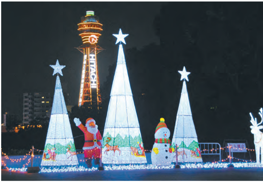
天王寺公園で開催中の「あべの・天王寺イルミネーション」

家族で参加する人も多く、子どもたちが杵をついたり餅を丸めたりして、にぎやかに迎春準備をします。餅の販売もあります。