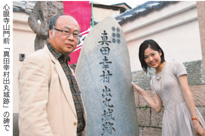
心眼寺山門前「真田幸村出丸城跡」の碑で