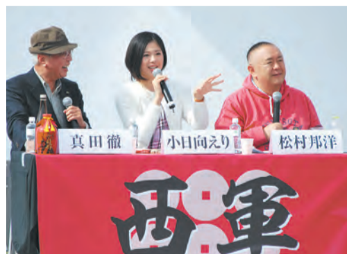
「天王寺 真田幸村博」ファイナルイベント 2万5000人が来場