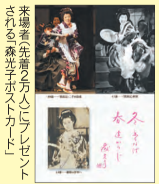
来場者先着2万人にプレゼントされる「森光子ポストカード」