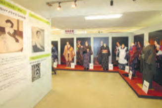
全長50mの年譜や衣装なども展示

たに上演されるのを記念し、近鉄百貨店上本町店で「92歳まで、人生大ロングラン! 女優 森光子展」が開催されています。会場では、森さんの92年間の写真入り人生年譜や直筆の名せりふ、実際に使われた舞台衣装などを展示。舞台映像も上映され、89歳まで半世紀にわたり『放浪記』は、作家・林