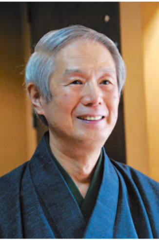
【予告】次号でインタビュー記事を掲載します。