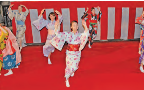
④豊国神社の豊臣秀吉像前で ⑤豊国踊りの様子