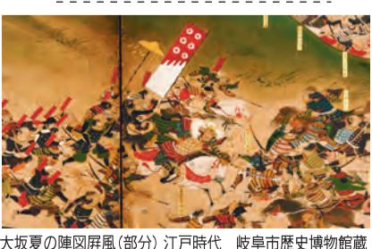
大坂夏の陣図屏風(部分) 江戸時代 岐阜市歴史博物館蔵