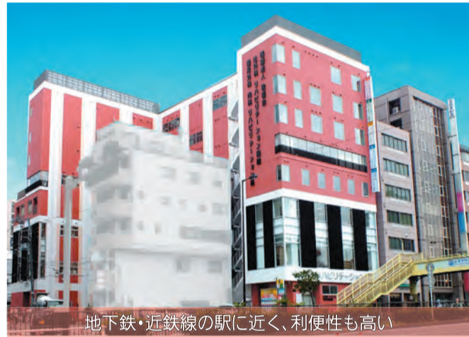
地下鉄・近鉄線の駅に近く、利便性も高い