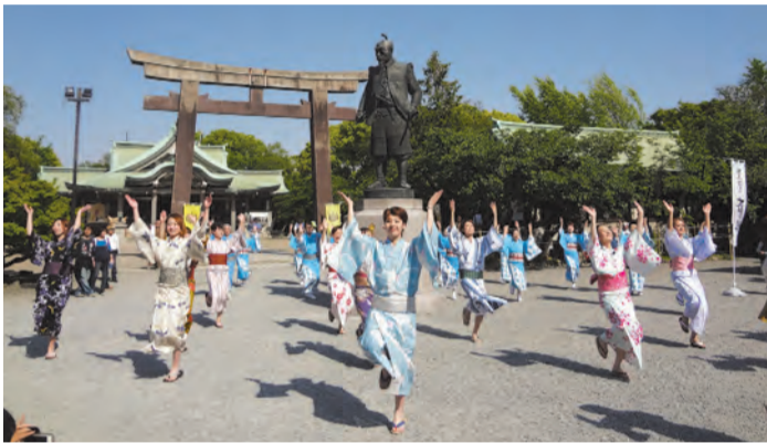
今年5月に行われた豊国踊り

大阪城天守閣で8月13日(土)、大阪の新しい夏の風物詩「豊国踊り」を一緒に踊ろうというイベント「大河ドラマ『真田丸』の舞台『豊国踊り2016』」が開催されます。 豊国踊りは1604(慶長9)年、豊臣秀吉の七回忌に、京都・豊国神社で1500人もの京都市民が捧げた踊りです。昨夏、大阪の陣400年を記念して再現。お披露目