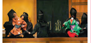
「瓜子姫とあまんじゃく」より

親子料金で観劇料がお得になる親子劇場。演目は、「瓜子姫とあまんじゃく」と「増補大江山 戻り橋の段」の2本立てに、「解説 文楽ってなあに?」。子どもには記念グッズのプレゼントやイヤホンガイドの無料サービス(要保証金)などの特典もあります。