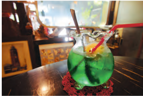
「金魚鉢のクリームソーダ」を求めて遠方からもお客さんが。