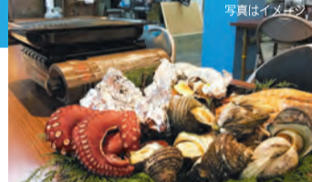
試食(予定): お造り「マグロ、サーモン、タコ」焼き物「エビ、貝類」 ※エビ、貝などアレルギーのある方はご注意ください

8/8(水) 午前9時半~12時半頃 鶴橋駅近くにある新鮮な魚介類が並び活気あふれる「鶴橋鮮魚市場」。プロの料理人が毎日買い付けにくる卸売市場です。今回の企画では、市場の方の案内で見学し、お話を聞き、用意していただいた新鮮な魚介を食べていただきます。スーパーの売り場では味わえない市場の魅力が体感できる内容です。夏休みの自由研究、思い出に。奮ってご参加ください。 ●受付時間: 午前9時~ ●集合場所: 鶴橋鮮魚市場内「つるはしキッチン」※参加者に地図を送付します ●見学場所: 鶴橋鮮魚市場(各魚介ごとの専門店) ●定員: 5組10人(保護者1人につき小学3~6年生のお子様1人)※兄弟がいる場合要相談、園児不可 ●締め切り: 7/25(水)※定員になり次第締め切ります ●参加費: 1人1600円(魚介試食代1500円、保険代100円) ●申込先: NPO法人まち・すまいづくり「うえまち」編集部「鶴橋鮮魚市場見学係」宛 Eメール uemachi@machi-sumai.com はがき 〒543-0043 天王寺区勝山1-11-29 ●問合せ: 電話06・6779・7222 ●協力: 大阪鶴橋鮮魚卸商協同組合(生野区鶴橋2-5-14)