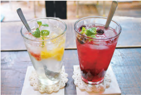
ソーダ割り590円、水割り500円(税込)