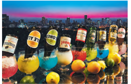
ビアテルは「+500円」でフリードリンクに。