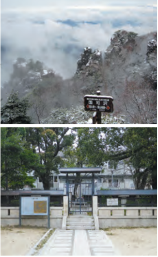
①福島県伊達市にある霊山 ②阿倍野区にある北畠顕家の墓

野津 いやいよ北畠公園へ来ましたね。ここは中に北畠顕家のお墓があるという、都市部では非常に珍しい公園ではないかと思えます。「太平記」には南北朝時代の初期、1338(延元3)年5月22日、北畠顕家が「和泉の堺安部野にて討死し給ければ」との記述があり、江戸中期の地誌学者・並河誠所が、もともと大名塚と言われていたものを、顕家の墓と比定して現在の墓碑を建てたこととです。なお、顕家戦死の地については、和泉の石津との説もあります。さらに、北畠公園から西へ約700m行ったところに阿部野神社があり、この神社は顕家が足利軍と戦った古戦場の跡に顕家とその父親房を祭神として、1882(明治15)年に創建されました。明治時代に入り、楠木正成をはじめ