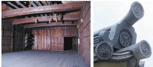
④現在の金蔵 ⑤金蔵の内部 ⑥金蔵の屋根瓦に見える徳川家の家紋「三葉葵」

榎本は戦果を大坂城の慶喜に報告するため開陽丸から下船しました。そこへもたらされたのが主君慶喜の脱出と江戸東歸の情報です。大坂湾にいた幕府艦隊は旗艦の開陽丸が離脱したことによって制海権どころではなくなりまし