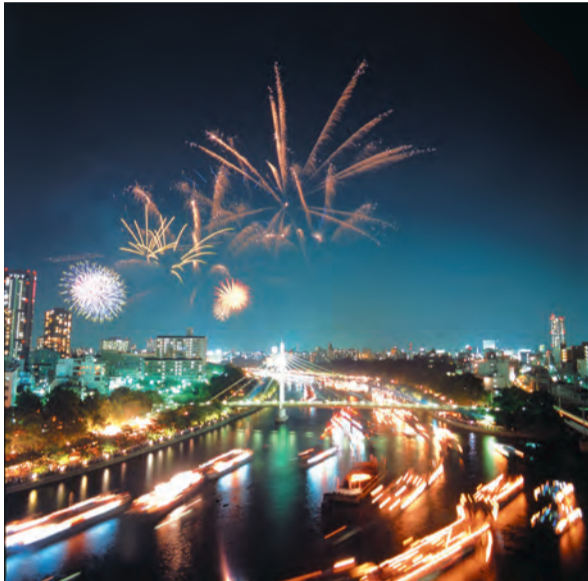
天神祭の船渡御と奉納花火

元四天王寺と伝わる由緒ある神社。夜は氏子による子ども向け屋台が並ぶ 中央区森之宮中央1-14-4 電話06・6941・9294