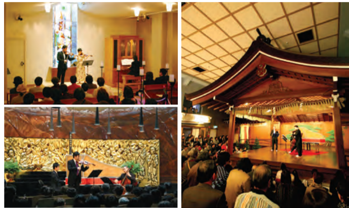
コンサートの様子・山本能楽堂(右)、セラトン都ホテル大阪のチャペル(左上)、一心寺三千佛堂(左下)

新年に将来への希望を 新年あけましておめでとうございませう。本年も上町台地の地域情報紙『うえまち』をよろしくお願ひ申し上げます。 年末の慌ただしい中で行われた衆議院選挙。新年の幕開けとともに、新しい政局の動きに期待や不安などあらゆる思いが巡ります。 現在の日本、そして関西、さらに大阪の景況は依然厳しく、誰もが暮らして仕事に明るい展望が見られることを願っているでしょう。 NPO法人まち・すまいづくりでは、住んで楽しいまちづくりを合言葉に本紙『うえまち』の発行をはじめイベント開催など、さまざま