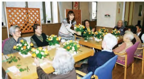
いきいきフラワー教室の様子

番のおもてなし。オリジナルシヨートコースを無料で試食できるチャンスです。人気のロビー人前式もぜひ体験してみたいかたが、いかがでしょうか。 本格的なドレスの試着やヘアメイクが体験できるイベントも多数開催。1月7・14・21・28日は、和装とドレス両方が一度に体験できる「和装・洋装ダブル体験会」を開催。1月3・12・20・26日は「プリンセス体験会」、1月5・13・27日は「和装体験会」。 いずれもヘアメイクとプロによる記念撮影が本番さながらに体験できます。ランチ付き。各日午前10時・正午・午後2時開始で1日3組限定。要予約。参加費無料。 2月28日まで「挙式・披露宴の新婦には、お色直しドレスのレンタルプレゼント。予算控えめな期間限定のお得なプランもあるの で、併せてチェックしてみたいかたが、いかがでしょうか。 問い合わせ・予約はライダルサロン(電話06・6772・5111)まで。 ▽ホテルアウイーナ大阪II天王寺区石ヶ辻町19-12