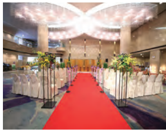
ロビー人前式と料理のイメージ