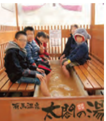
足湯体験(左)、豊臣秀吉画像(大阪・豊国神社蔵)

大阪城天守閣は1月2・3日、天守閣内の小天守台、2階会議室で「迎春イベント」を開催します。午前9時30分～午後4時。 足湯体験や甘酒の振る舞い(なくなり次第終了)を予定。足湯は、豊臣秀吉が戦で疲れた心身を癒やすため通ったといわれる有馬温泉「太閤の湯」を大阪城へ運び込むもので、冷えた体をほっこり温めます。新年を祝い、福を呼ぶ「めでた獅子」も天守閣内で練り歩きます。 天守閣内では、冬の展示「史料と写真でたどる豊臣秀吉の生涯II 関白、太閤、そして神になった秀吉」や常設展「『彩り』と『輝き』の工芸品」のほか、「第41回大阪城写真画展」が開催されます。詳細はホームページで確認ください。 開館時間は午前9時～午後5時(入館は4時30分まで)。入館料は大人600円以下無料。 ▽大阪城天守閣(中央区大坂城1-1、電話06-6941-3044)