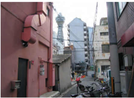
隙間的な市街地にあっても存在感を示す高塔・通天閣

の都市拡張期などに建てられた教会の高塔は、人々の高さへの憧れや他都市のものより高くといい競争心・虚栄心の表れであったと、高名な美術批評家であり社会評論家ジョン・ラスキン(英国、1819〜1900年)は言っています。真摯