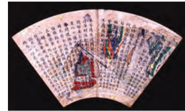
「扇面法華経冊子 雪中訪問図」(国宝・平安時代)

宗総本山 四天寺 寺の歴史や仏教文化伝える宝物の数々 四天寺宝物館で1月1日～3日、「平成25年四天寺新春名宝展」が開かれ、宝物を通して同寺の歴史や仏教文化を広く知ってもらおうとするもので、普段観覧する機会が少ない国宝・重要文化財が多数展示されます。 国宝「扇面法華経冊子」(平安時代)は、金銀の装飾を施した扇形の紙に極彩色の下絵を書き、経文を書写したもので、当時の最先端の技法が駆使されています。国宝・懸守(桜枝折文・桜透丸文)は女性や子どもが用いたお守り。華麗な装飾から、高位の人物が所持品を奉納したものと推定されます。 開催期間中は無休。午前8時30分～午後4時(1月21日は午前8時～午後4時30分)。入館は閉館20分前まで。拝観料大人500円、高校生以下無料。 ▽四天寺(天王寺区四天寺1-11-18、電話06-6771-0066)