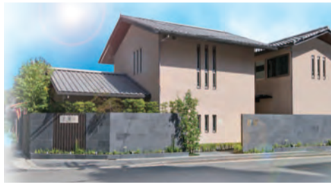
メモリアルハウス花堀江

放的で明るく温かみを感じるアットホームなお別れの空間(葬儀場)を運営しています。同ハウスのスペースを生かして、カルチャー教室や地域の集會等さまざまな活動での利用や、高齢者向けのイベント企画などで地域の交流施設を目指しています。 ▽日比谷花壇ライフサポート事業部II西区北堀江2-2-21、電話0120-11-3987(メモリアルハウス花堀江内)