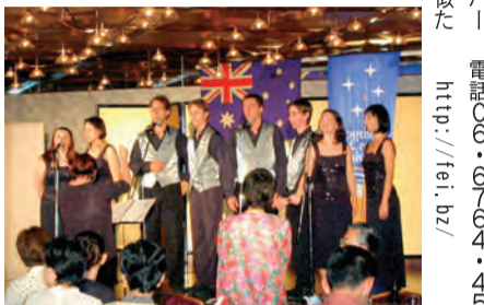
イロハス・クールの授業の様子(上)、イザベラ・ア・カペラ(下)

イロハス・クール 小学生対象の進学塾エフイーアイは、理科系の頭脳を鍛える低学年向けの能力開発スクール「イロハス・クール」を開講しています。脳科学に基づいた楽しいプログラムで子どもの学習能力を育成します。中学受験にも効果的のこと。