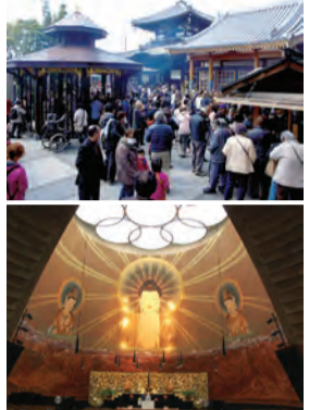
「3・11を忘れない!」ブロンズ像(右)、初詣の様子(左上)、三千佛堂(左下)