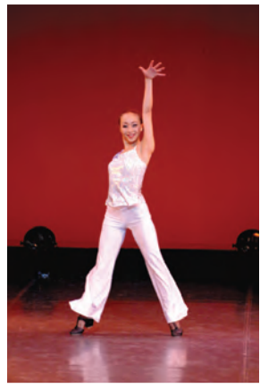
イロハス・クールの授業の様子(上)、イザベラ・ア・カペラ(下)

イザベラ・ア・カペラは1984年、サザンクロス大学音楽学部の学生で結成され、現在メンバーは12人。カーペンターズにも似た 1月11日(金)には、宝塚市内でコンサートを行います。 コンサート・ツアーの日程はホームページで。 ▽進学塾エフイーアイ(イロハス・クール) 天王寺区清水谷町1-7-6、ウノシヨウビル1階、電話06・6764・4599 http://fei.bz/