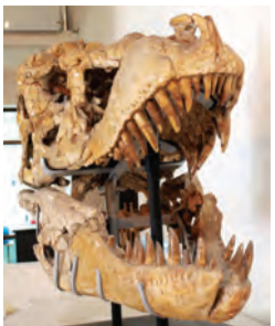
タルボサウルスの頭骨

大阪市立自然史博物館で6月2日まで、特別展「発掘！モンゴル恐竜化石展」が砂漠の恐竜化石はなぜ古生物学者を惹きつけてやまないのか?」を開催しています。来 世界有数の恐竜化石産地であるモンゴル・ゴビ砂漠で発掘された化石を紹介。日本とモンゴルの共同調査隊が発掘した標本をはじめ、ほとんどが「実物化石」で、ほぼ全身の骨が保存された子どものタルボサウルスや巣の中で化石になったプロトケラトプスの赤ちゃんなど、細部まできれいで貴重な化石が見られます。日本初公開のものも多く、モンゴルの恐竜の特徴を紹介するとともに、恐竜の実に迫ります。 大人1200円、高校・大学生800円、中学生以下・障がい者手帳等を持参の人(介護者1人を含む)は無料。 ▽大阪市立自然史博物館(東住吉区長居公園1-23、電話06-6697-6221、開館時間は午前9時30分～午後4時30分(2月28日まで)。月曜日・年末年始は休館)