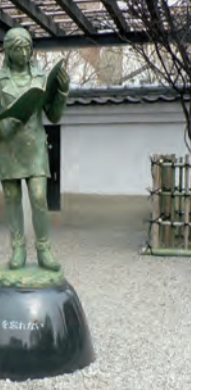
「3・11を忘れない!」ブロンズ像(右)、初詣の様子(左上)、三千佛堂(左下)

三千佛堂は市道を隔てて境内の東側にあります。回廊には皆さまのご寄進によって造立される「千躰(体)佛」を祀ります。回廊を右回りに3回巡拝していただき、諸仏に懺悔(さんげ)滅罪をお祈りください。さらに、回廊には千躰佛全体の守護神として「十二神将」をお