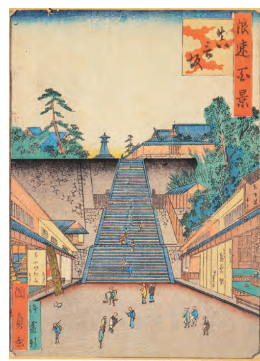
浪花(浪速)百景・真言坂(大阪城天守閣蔵)

上本町で24年間英語教育に携わってきた実績を持つプロスランゲージセンター内に併設のプロスキッズに、4月から午前10時スタートのコースが開講します。今年4月に幼稚園年少組および年少組へ入園する子どもが対象。プロスキッズでは2歳児の最年少組から年少組までの2年間、英語保育の環境の中でさまざまな活動に取り組み、英語を道具として使う感覚を養っていきます。英語の習得には毎日の積み重ねが重要です。耳が英語の音に慣れるように、ロングコースで毎日登園することが非常に効果的です。しつけ教育も充実していて、英語の習得だけでなく子どもの自立や成長をしっかりとサポートします。無料体験を実施しているので、親子で一緒に体験してみたいかがあります。