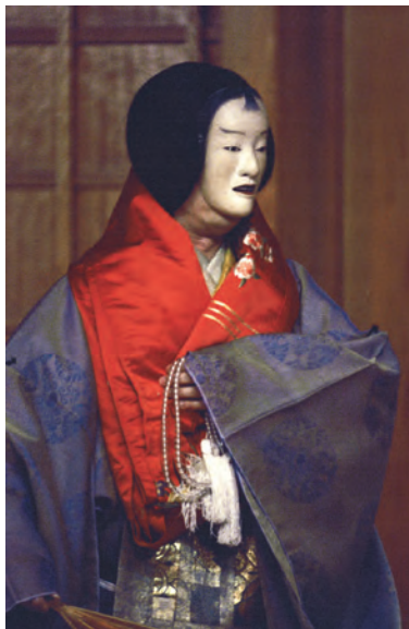
「自然居士」の一場面