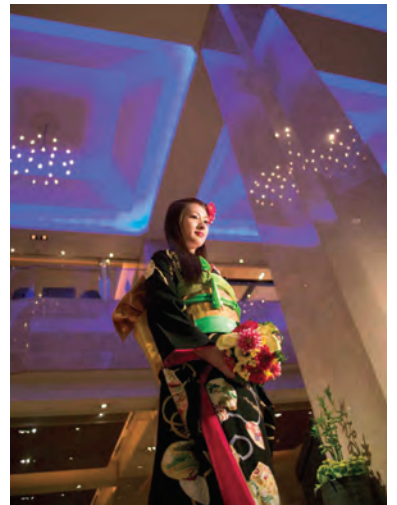
ウエディングフェア (イメージ)