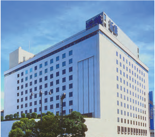
近鉄百貨店上本町店