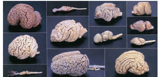
あらゆる動物の「脳」を展示

最大級の脳を持つマッコウクジラまで、あらゆる動物の脳標本や、何で倒れても自ら立ち上がる方法を考える