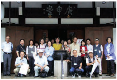
庚申堂の前で記念撮影

NPO法人まち・すまいづくりは、6月15・22・29日、7月6日の4週連続金曜日、大阪歴史博物館と協力し、「上町台地歴史講座2」を開催しました。16人の参加者とまち・すまいづくりスタッフが大阪歴史博物館学芸員の大澤研一氏の先導で上町台地の歴史名所を探索しました。