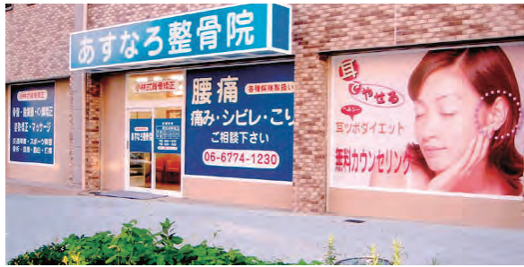
あすなる整骨院は鶴橋駅近く

すなわちでは、骨盤矯正や耳ツボダイエットのカウンセリングを実施。代謝が落ちて体型が気になる30代以上の女性や、ウエストが気になる働き盛りの男性を健康と美容の両面でサポートしてくれます。