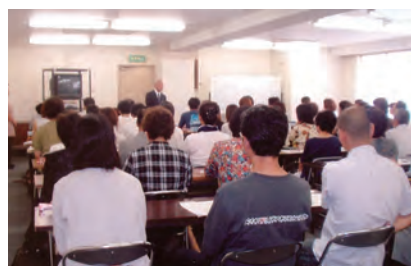
松下介護学館ホームヘルパー講座の様子

松下介護学館は、ホームヘルパー2級の資格を取得できる講座をはじめ、介護サービスマニエール、医療事務の要請講座など多彩な講座を開講しています。