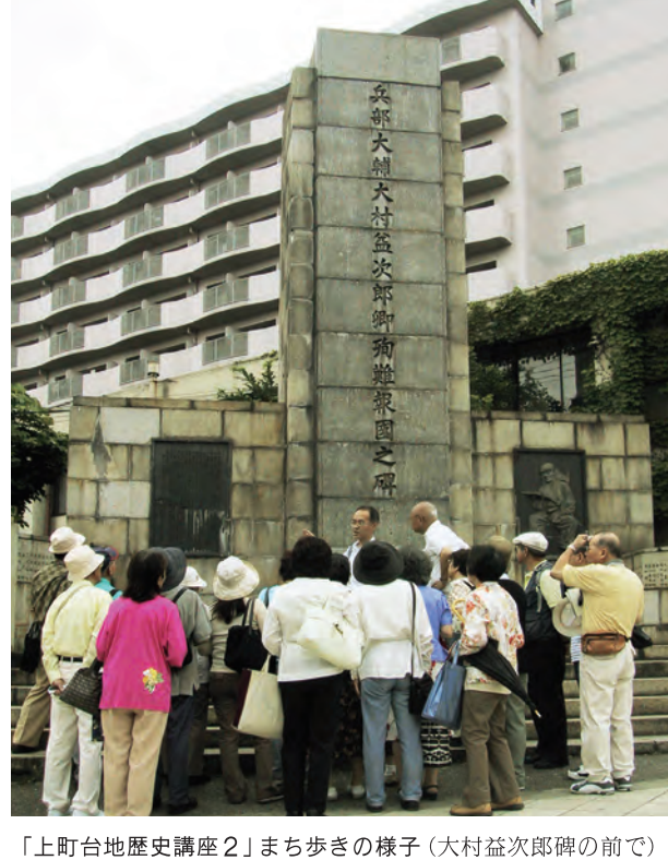
「上町台地歴史講座2」まち歩きの様子(大村益次郎碑の前で)

…ご案内… 「一心寺日想殿で日観の会」開催 「上町台地歴史講座3」秋のお彼岸時期、夕陽の名所を楽しむイベントを開催。参加者を募集します。2面に詳細を掲載。 『うえまち』秋のイベント まち・すまいづくり