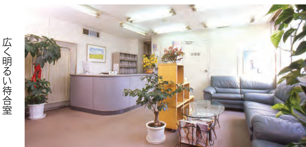
広く明るい待合室

土・日曜日の講座を働きながら受講したり、夏休みを利用して受講したりする学生もいるそうです。講座修了者には会報の発行や就職研修講座を実施しており、バックアップ体制も充実しています。認知症ケアの基本講座やガイドヘル