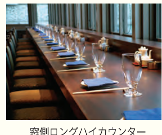
窓側ロングハイカウンター

ステーションプラザ天王寺4階にある「北京料理百樂」はこのほど、旬・食材にこだわった新しい形のチャイニーズレストラン「HYAKURAKU TENNOJI 中国料理百樂」としてリニューアルオープンしました。 店内はライブ感伝わるオープンキッチン、景色が一望できる窓側ロングハイカウンターに一新。無農薬有機肥料栽培野菜を使用、ブランド鶏・豚の原産地表示、旬魚メニューなど新しい料理も登場。油には紅花油を使用し、健康にも気をつかっています。厨房内の炉焼き窯で作るチャイニーズは、一食の価値あり。また、かめ出し紹興酒は酒質の劣化がほとんどなく、紹興酒本来のまろやかな味を楽しめます。 ▽HYAKURAKU TENNOJI 中国料理百樂 天王寺区恵田院町10-48、ステーションプラザてんのうじ4階 電話06-6779-6546