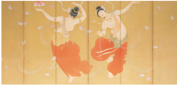
土田麦徳「散華」(部分) 1914年(前期展示)

心齋橋展示室で「名画の理由」コレクションによる日本近代絵画の世界展が開催されます。