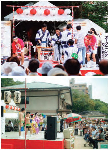
彦八まつりの様子(写真は昨年以前のもの)

9月1・2日、生國魂神社で年に一度の落語家によるファン感謝祭、「第17回彦八まつり」は大落語の