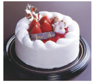
苺と生クリームのクリスマスケーキ

家族や仲間と楽しく過ごすクリスマス。子どもたちや女性の楽しみは大好きな人から送られるプレゼントともう一つ、一年に一度の聖夜を演出するホテルメイドのケーキはいかがでしょう。