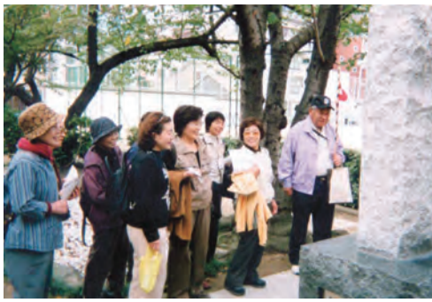
上町台地の旧跡をめぐるハイキング

10月23日午後1時30分出発。集合場所は近鉄上本町駅中央コンコース。夜来の雨をズルズルと引きずって、少し心配しましたが、何とか上がりました。総勢50名ほどが参加