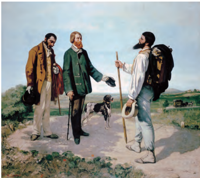
クールベの代表作「出会い、こんにちはクールベさん」

『どうぶつ』を抽選で1名にプレゼント。ご希望の方は編集局までお申し込みください。(11月末日締め切り)