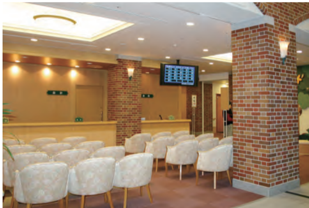
れんが造りのイメージで統一した院内とチャペル