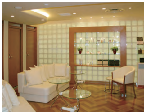
明るいエントランスと落ち着いた店内