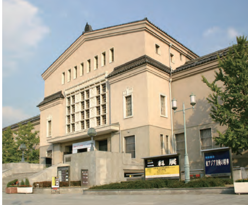
天王寺公園内にある大阪市立美術館は1936年開館。住友家の本邸と庭園(慶沢園)の敷地が大阪市に寄贈され、建てられました