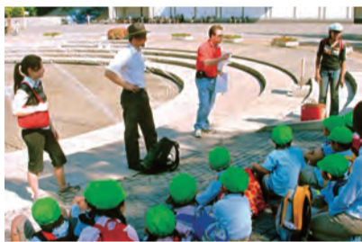
遠足など課外授業も多数実施

る帰国子女生やブリススクール卒業生も多数通っています。授業はネイティブスピーカーの主任講師と経験豊富な日本の英語教師、幼稚園教師、保育士などの免許保持者がサポート。欧米と日本の教