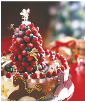
20周年記念特製クリスマスケーキ

ムをたっぷり挟んだスポンジケーキとして「苺と生クリーム」のクリスマスケーキと「木苺と生チョコレトクリー