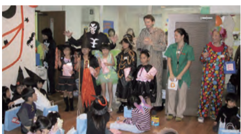
教室で開かれたハロウィーンパーティー