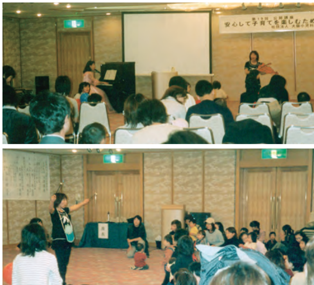
毎回たくさんの親子が参加

11月1日、聖バルナバ 病院の新病院が完成、診 療を開始しました。10年 の建設構想により完成し た新病院は「母と子の専 門病院」として女性のラ イフスタイルを重視し、 最新設備を擁する診療体 制を整えています。 建物は患者と家族のア