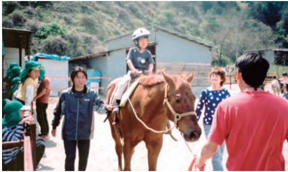
「元気っ子」の野外活動で乗馬を体験