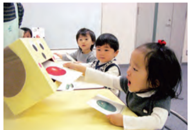
ワーキングメモリーを鍛える楽しい授業

近年の脳科学の研究成果「ワーキングメモリー」を取り入れた独自の教育は、一人一人の成長に応じた能力を引き出しながら人間性を育むとともに、有名幼稚園への進学や小学校受験に必要な知識も自然と身に付きます。