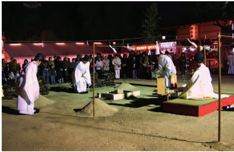
2月3日夕刻 生國魂神社「節分祭・祈禱木焼納祭」