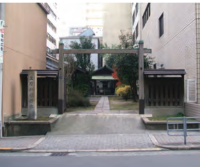
現在の坐摩神社御旅所(王子伝承地)

前身で、その数は九十九王子といわれるほど多くありましたので、その場所が分かれれば熊野街道のルートがつかめます。そして、その最初の王子は渡辺津にありました。渡辺津にあった王子社は渡辺王子、そして渡辺津の異名を冠して窪津王子・大渡王子とも呼ばれました。