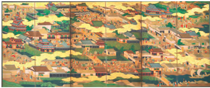
京・大坂図屏風 六曲一雙のうち右隻・大坂図

大阪歴史博物館は2月2日から、特別展「天下の城下町―大坂と江戸」を開催します。3月25日まで。