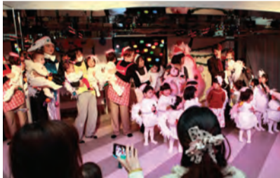
クリスマスファッションショーの様子

親子で楽しむ季節ごとのイベントも充実。年末にはクリスマス会を開催し、普段はフレイタルショーで使われている本格的な舞台上で、子どもたちが可愛らしい衣装を身に包みファッションショーを行いました。無料の体験保育を随時実施中。温かな雰囲気のある園へ一度遊びに来てみませんか。