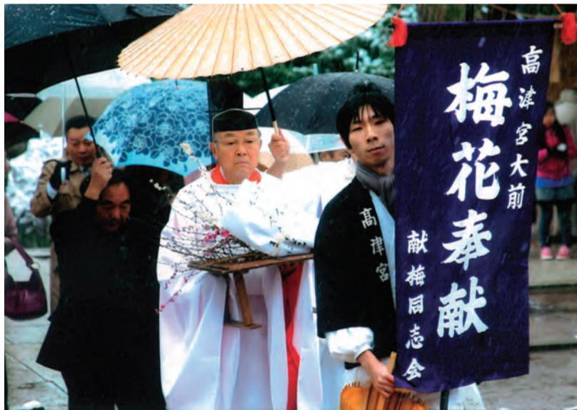
2月11日午前10時頃 高津宮「献梅祭」