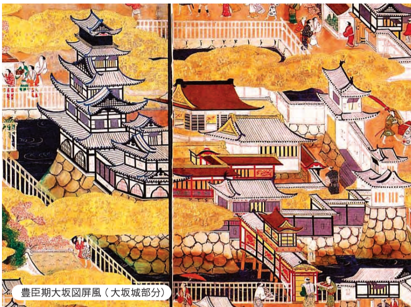
豊臣期大坂図屏風(大坂城部分)