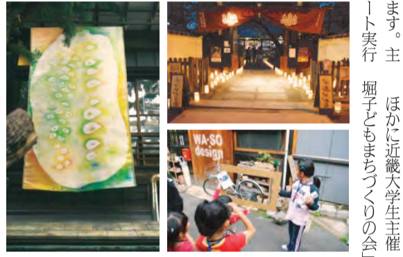
まち全体がアートな空間となる

昔ながらのまち並みが残る空堀かいわいの長屋や石畳の路地など、まちのさまざまなスペースに、公募によるアーティストの作品を展示するアートイベント「からほりまちアート」が今年も10月24・25日に開催されます。