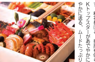
創作料理おせち「和食三段重」

生との接点が多くあります。大阪は古来、海外交流の窓口・原点でもあり、東アジアとの交流のなど、素晴らしい歴史が認知されていないことに不満を感じています。上町台地について少し勉強してみますと、次々と知らされる豊かな歴史に驚きを隠せません。大阪の人、若い人には大阪に興味を持って知識を深め、誇りに思ってもらいたいものです。建築など設計にかかわる人には特に歴史を知ってもらいたいと述べました。私には、若い人に歴史を知ってもらいたいと述べました。私には、若い人に歴史を知ってもらいたいと述べました。