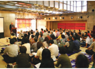
「日想観のつどい」昨年の様子

しての高さがないのです。夕陽丘に立って初めて、真西に250mの鉢伏山をかすめてわずかなすき間ながら明石海峡が播磨灘へと続くのを見通すことができるのです。そして春秋のお彼岸、殊に中日には太陽が真西の明石海峡に、つまり山並みが途切れるわずかなすき間に落ちていくのがたいものとして受け止めました。すなわち夕陽丘、一心寺