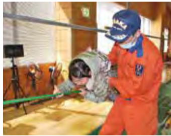
天王寺消防署 防災のつどい