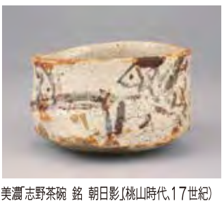
美濃志野茶碗 銘 朝日影(桃山時代、17世紀)

神戸市御影にある「香雪美術館」が開館45周年を記念し、中之島フェスティバルタワー・ウエストに新しく「中之島香雪美術館」を開館しました。香雪とは、多くの美術品を収集した朝日新聞社の創業者・村山龍平さんの号。本館のコレクションの優れた美術品など約300点を選び、展示する記念展シリーズ「珠玉の村山コレクション」を愛し、守り、伝えたいと、1年に渡り開催されます。