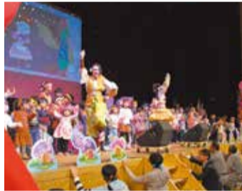
2018防災フェスタinあべの

10日に天王寺消防署で開催された「防災のつどい」では、参加者は地震車や防災体験シアターなどで実際の震災の雰囲気を実験。はしご車の登場やロープ渡過(とか)体験などあり、子どもたちが楽しみながら防災の大切さを学びました。