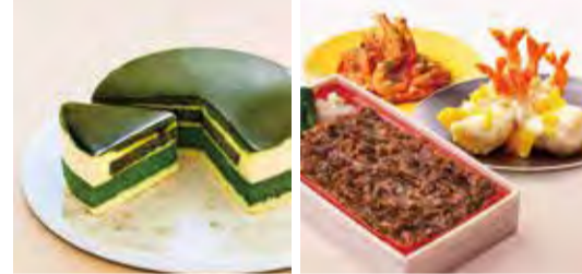
④うえまちマルシェ(イメージ) ⑤地下2階・京都ヴェネト ⑥地下1階・柿安ダイニング

とも可能です。生活雑貨の「ファンデュース」、ヘルシーフード・オーガニック化粧品の「ヴェータヴィ」、旅行用品の「ヘイス」ト