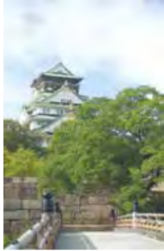
【右側】京橋口 ④⑤⑥ 2月24日に 行われた「学芸員とめぐる慶喜の 大坂城脱出ツアー」の様子(京 橋口付近) ⑦ 八軒家船着場にて水 上バスに乗船