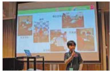
「おおさか 未来の防災」でのセミナーの様子