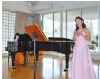
おおさか 未来の防災 チャリティーコンサート

たとえば3月4日、クレオ大阪中央では「おおさか未来の防災 チャリティーコンサート」と題したイベントが開催されました。