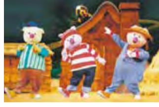
大阪市仏教青年会 facebook

午後1時~4時 会場 クレオ大阪中央 入場料 無料、申込不要 4/8にお釈迦様が生まれたのにちなみ、全国の寺院でお誕 生日を祝う行事が行われています。大阪市仏教青年会では毎 年この時期に「子ども花まつり大会」を開催しています。誰 でも気軽に参加できるイベントで、お芝居や抽選会が楽しめる 子ども向けの内容です。お土産付き。