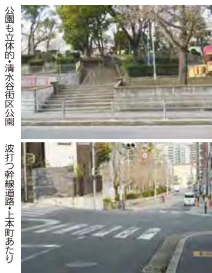
公園も立体的 清水谷街区公園 波打つ幹線道路・土本町あたり

上町台地には変化に富む地域風景が広がっています。大阪城から住吉を経て、さらに南方にまで伸びる台地周辺は、平坦地の多い大阪平野のなかでは珍しい、起伏の多い市街地をつくっているのです。土地の傾斜度合いは様々