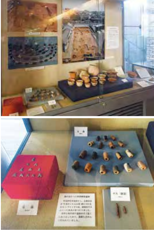
⑤阿倍野区民センターにある街角ミュージアム ⑥土錘(上)、ヤス(右)、石鏝(左) ⑦立体表示した弥生時代の古地理図