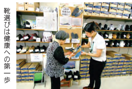
靴選びは健康への第一歩

暑い季節、靴の中が蒸れて気持 ちが悪いという人は少なくないで しょう。「蒸れの原因は足裏にか く汗。靴と足の間に余分な隙間が あると蒸れやすくなります」とお フット&シューマイスターの異邦 人スタッフ。靴がびっぴり合っ ていないと足が不安定になり歩行時 に踏ん張ろうとして力みが出て汗 をかき、蒸れてしまうとのこと。 力みは足の疲れや膝への負担も伴 うのでトラブルの原因となり要注 意だそう。