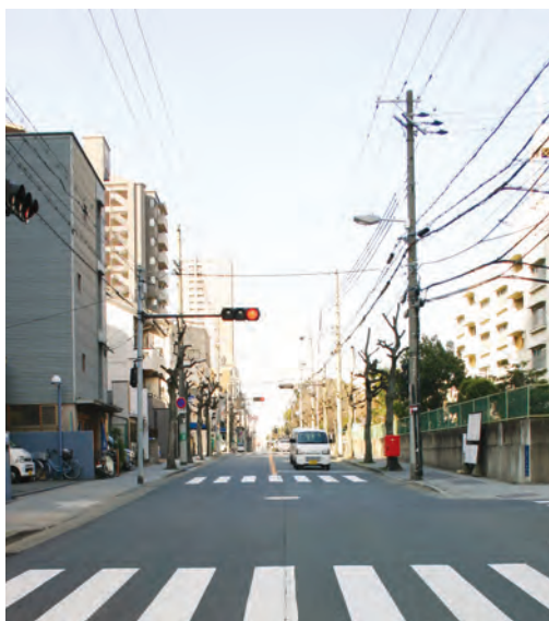
東から見た太夫殿坂。なだらかな傾斜が続く

前回の安国寺坂に続き、今回大阪医療センター(旧国立大)の東西南角の「上町」交差点から東へ向かう道があります。難波宮史跡公園の南に接する道です。最初はやや上りですがまもなく東へと下り