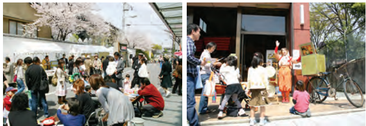
毎年多くの子どもたちと家族でにぎわう「なにわ人形芝居フェスティバル」