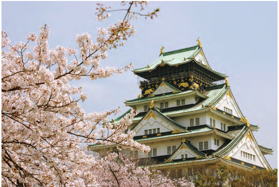
桜とともに美しく春空に映える大阪城

大阪市内の中でも緑が多く見られる上町台地。織田作之助が「木の都」と表したように、季節を感じさせる木々がやがて来る春を待ちわびているよつです。