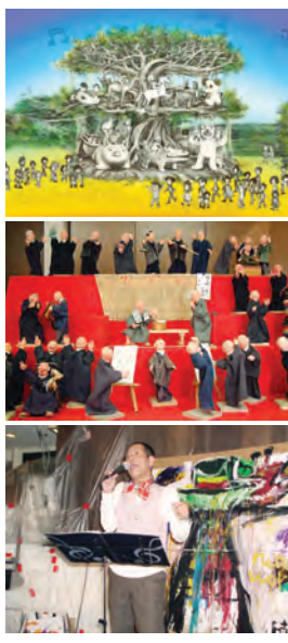
お楽しみが盛りだくさん

「おもいでいっばい♡」▽せくらせ(大阪大学)「まんげつサカス」▽たんぼぼ(京都女子大学)「三枚のおふだ」▽劇