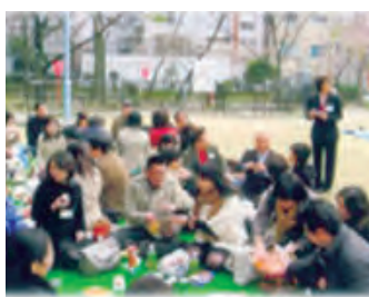
縁結びパーティー(以前の様子)

自持ち寄り(飲み物は主催側で用意)。申し込みは高津宮ホームページまたは富亭カフェで受け付け中。3月16日締め切り。応募多数の場合は抽選になります。