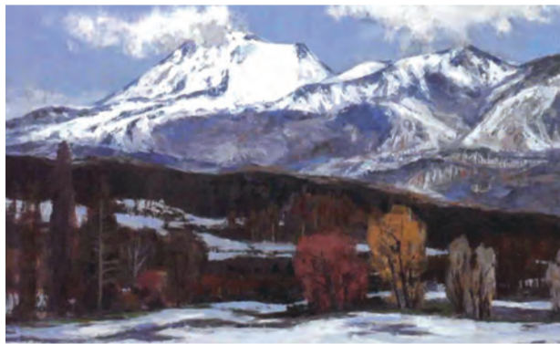
三沢忠「浅間山」文部科学大臣賞(洋画・上)