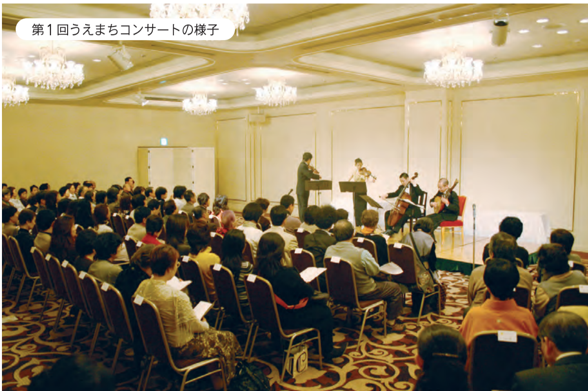
第1回うえまちコンサートの様子

うえまちの音色を奏でる 上町台地が大阪の文教地区かつ都心のオアシスといわれる要因は、医療機関や教育施設などの充実と、その背景にある豊かな歴史・文化です。しかし、毎日の慌ただしい生活の中では、そうしたうえまち地域ならではの恩恵にあずかり、暮らしを楽しむ機会は少ないものです。 本紙『うえまち』はこれまで上町台地の歴史名所や伝統文化などにスポットを当て紹介してきました。今後そのテーマは変わりませんが、さらにもう一つ、日常の風景に見られる色や音、上町台地のわずかな表情にも目を向け、「学び」「楽しむ喜び」「癒やし」などうえまちの人々が心豊かに暮らせるような話題や場を提供していきたいと思えます。 新年早々に開催した第1回「うえまちコンサート(記事別掲)」も盛況に終わり、次回の開催を案内する運びとなりました。「うえまちを楽しむ」企画として、うえまちの音色を奏でていくことができると考えています。 (まち・すまいづくり)