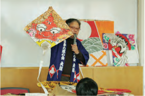
難波宮跡で凧揚げ(上)、凧作り(中)、日本の凧の会大阪支部の会員が凧の説明をする様子(下)

江戸時代、大阪城西にあつた馬場は凧揚げのメッカでした。その様子は錦絵「浪速百景」などに描かれており、大阪の人なら誰でも知っていた冬の風物詩です。今回の歴史講座はその