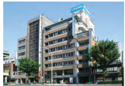
医療法人歓喜会・社外科病院

同会は社外科病院、介護老人保健施設いんぼつ夕陽丘をはじめ、介護付有料老人ホーム・ケアリビング楽寿、訪問介護事業ヘルパーステーションみどり、居宅介護支援事業所ケアプランセンターなど福祉介護にかかわる施設を運営しています。