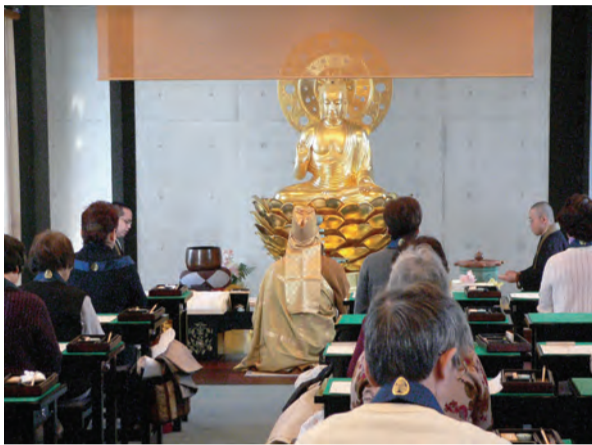
写経会で表彰(上)と写経堂の様子(下)