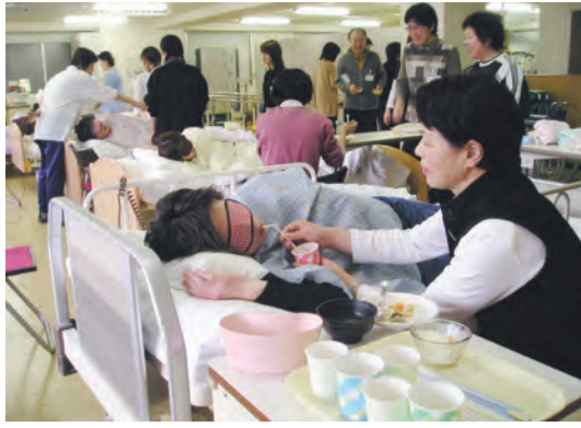
ホームヘルパー講座の実習は社外科グループの充実した介護福祉施設で受講することができる

医療法人歓喜会は、家庭介護から福祉施設まで対応するホームヘルパー2級の資格を取得できる、大阪府知事認可の「つじホームヘルパー養成通信講座」を開講。今春4月に開講する講座の受講生を募集しています。今すぐ就職・転職したい人、家族介護のために資格取得を考えている人は、思い立った今が受講のチャンスです。