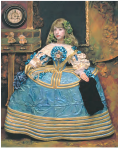
上田備山「漁」1930年代(上) 森村泰昌「美術史の娘(女王B)」 1990年(下)

大阪市立近代美術館建設準備室と特定非営利活動法人記録とメディアのための組織「remo」は1月26日〜3月23日、大阪市立近代美術館(仮称)心斎橋展示室で「写真の美術・美術の写真」『浪華』『丹平』から森村泰昌まで」を開催します。