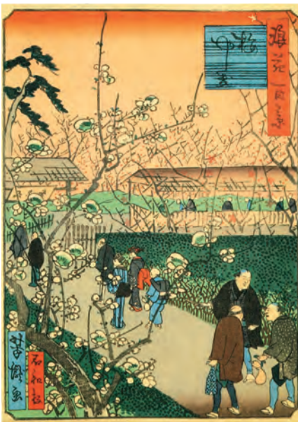
「梅屋敷」を描いた浪速百景(上)と高津宮の「梅の橋」

こうしてみると、上町台地はあちこちに梅見のポイントがあったようです。では、「紙上梅見」はこの辺にして、いい所を探しにちよつと出掛けてみましょうか。