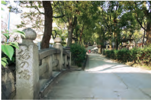
高津宮の梅も有名です。ここは花だけではなく、参道の流れは梅川(これは道頓堀の源流といわれています)、名水といわれた梅の井、そして鳥居から東へ出て谷町筋との辻を梅の辻と呼んだほど、境内丸ごと「梅一色」です。