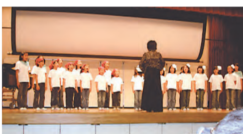
子どもコーラス (以前の様子)

料金は子ども(6-15歳)600円、大人(16-64歳)1200円、高齢者(65歳以上)800円、付き添い観覧2000円、貸し靴3000円。2月22日からシーズン終了カウントダウン割引として、子ども300円、大人