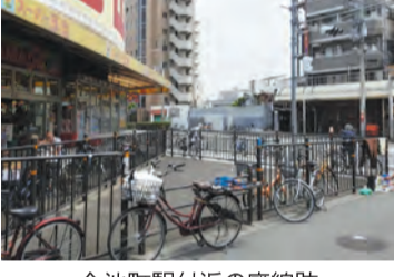
今池駅付近の廃線跡