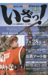
※屋外夜希望を明記