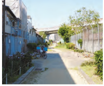
阪堺電車「天王寺線跨線橋」