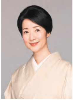
光景だった。久しく廃曲になっていたのを、観世流では2001年に同能楽堂で復曲上演し、再演を重ねてきました。

大槻能楽堂は7月8日(土)午後6時30分から、「源氏物語」朗読と能「空蝉」をテーマに幽玄情緒たつぷりのろうそく能を開催します。