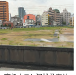
高級ホテル建設予定地