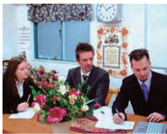
講師同士の会議を実施