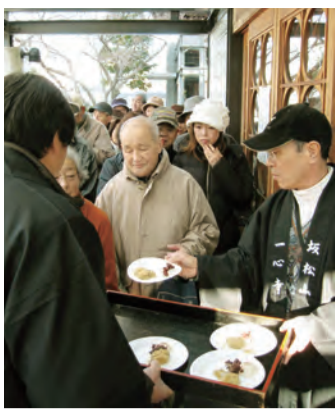
おもいを求めて行列が...

一心寺では年の暮れの 29日にもちつきをし ます。世間では数字の語呂 合わせで「9は苦に通じ る」として、もちつきや その他のお正月の準備を 嫌う風習がありますが、 それを逆手に取り「苦を つきこんでしまおう」とあ えてその日にもちつきを します。 住職や長老をはじめ、 一心寺出入りの業者さん