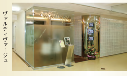
ヴァルディヴァージュ