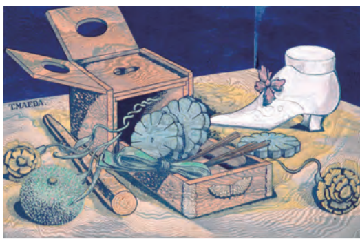
美しきエスプリ (1931年)

『どろんこハリー』を抽選プレゼントで1名にプレゼント。ご希望の方は編集局までお申し込みください。(1月末締め切り)