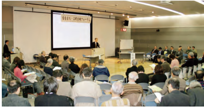
フォーラムの様子(上) まちづくり団体の活動発表(下)

昨年12月17日、大阪府が主催する「マイルドHOPEゾーン事業(※)」のキックオフイベント、「住むまち・上町台地フォーラム」が大阪市立住まい情報センターで開催されました。同イベントは、大阪府が上町台地(丁R大阪環状線内側の約900ha)を都心居住のモデルゾーンと位置付け、2005年度から実施している「マイルドHOPEゾーン事業」の第1ステップ。上町台地の魅力と多彩なまちづくり活動を紹介し、住むまちとしての魅力発信とまちづくり団体の交流を図るもの。 上町台地で居住魅力の向上に取り組みNPOなど、まちづくり活動に取り組む23団体が一堂に会し、まちづくりの専門家も加えて展開されました。