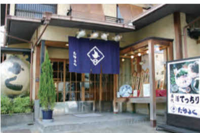
玉造筋に面した「たらふく」