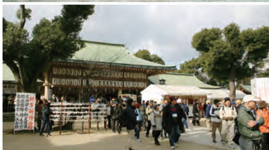
節分祭護摩木焼納神事 (上) お正月の境内 (下)

天王寺区生玉町にある生國魂神社(いくくにたまじんじや、通称生玉さん)は、大阪の歴史の中心として「難波の大家」と尊称され、「いくたまさん」と親しまれています。いくたまさんの