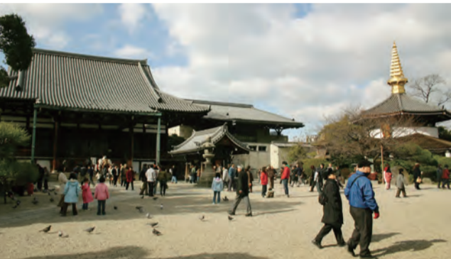
年末年始、参詣者でにぎわう境内の様子

作。ここは僧侶の出番で す。3升分のアツアツの おもちの塊を大きい麴 (こうじ)ぶたに移し、 手に付かないように取り 粉を振りながら こねていきま す。上になる部 分を下にして、 丸の中心に向 かって左右前後 交互に何回も何 回も引っ張って 伸ばしていきま す。最後にひっ くり返して餅箱 へ、形を整えて すぐさま扇風機 で冷やす。お見 事、玄人はだし です。このよう にして約30カ所