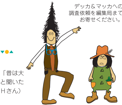
デッカ&マッカへの調査依頼を編集局までお寄せください。

この空砲の音は大阪城の周りだけでなく、大阪市中に響き渡って重宝されたんやて。そやけど、明治12、13年ごろには使われへ