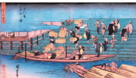
浪花名所図会・八軒屋着船図(歌川広重画)

大阪歴史博物館は4月22日(土)―6月12日(月)、特別展「開館5周年記念 水都遊覧―大阪は実に橋の都なり水の都なり」を開催します。 同博物館が所蔵する、「水の都」大阪を描いた絵画作品や大阪の海や川にちなむさまざまなジャンルの資料を展示し、大阪がかつて「水の都」だった歴史を振り返ります。同博物館は今年11月に開館5周年を迎えます。