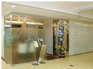
ヴァルディヴァージュ