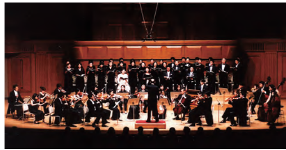
テレマン室内合唱団と室内管弦楽団の演奏

日本テレマン協会は6月16日、中央区城見のいずみホールで第170回記念定期演奏会「ハイドンVSモーツァルト」を開催します。