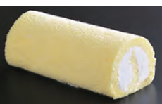
ホワイトチョコ レイトロール

近鉄上本町駅コンコース内にある都ホテル大阪直営ケーキ店、LA PATISSERIE DE MIYAKO (ミヤコ) はホテルメードの本格スイーツを気軽に楽しんでもらいたいというコンセプトの下、2005年度「現代の名工」を受賞し