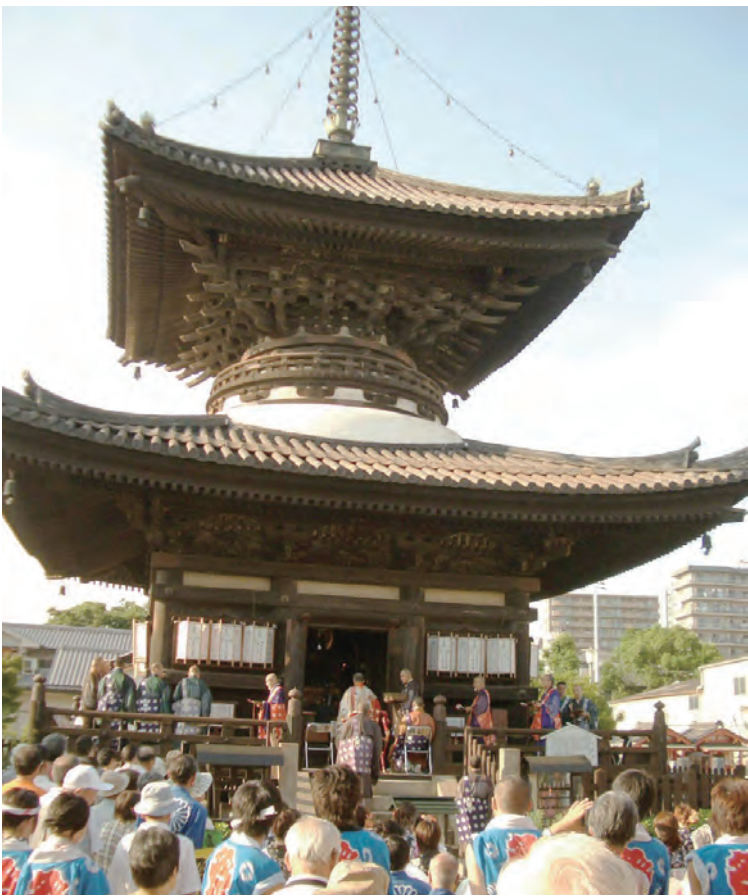
愛染まつり (昨年の風景)

美しく咲いた桜が散り、五月雨の季節を迎えています。まもなく初夏の気配も感じられること、まつり関連記事を別掲