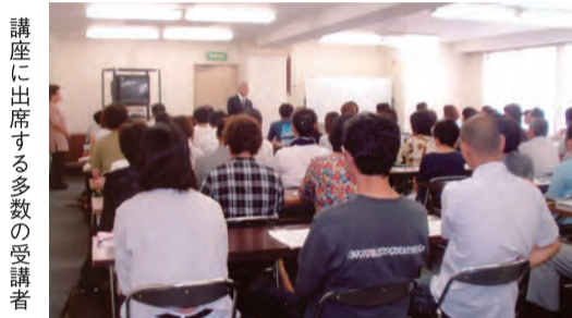
講座に出席する多数の受講者

就職研修講座を行うなど、バックアップ面も充実。認知症ケアの基本講座やガイドヘルパー養成講座、介護福祉士国家試験対策講座なども開講している。ステップアップを目指す環境が整っています。