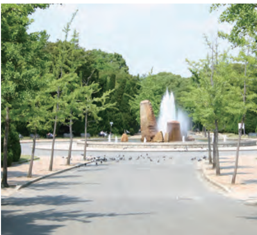
江戸時代の「杉山」辺り(大阪城公園内)