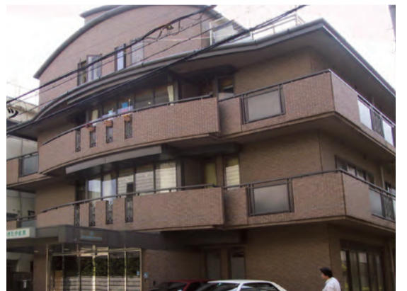
四天王寺きたやま苑

所もあり、万一の場合も安心。自宅での生活を望む高齢者やその家族には、介護支援専門員（ケアマネジャー）が豊富な知識と経験で個人に合わせたケアプランを作成し、より快適な生活をお手伝い。在宅介護支援センターとして、介護に関する相談に応じてくれます。