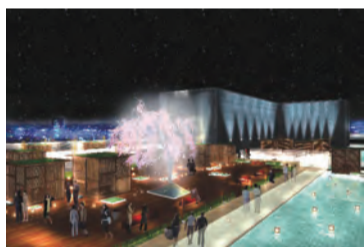
屋上庭園ダイニングのイメージ

5月27日、天満橋大中之島新線の分岐点と川沿いに京阪シティモール(シテイモ)がグランドオープン。京阪人を中心に支持を受けています。8階のレストランからオーダーできる庭園ダイニングを展開。屋上庭園は人口の池や川、滝を配し「水都・大阪」を表現しました。大阪の新しい名所になりそうです。