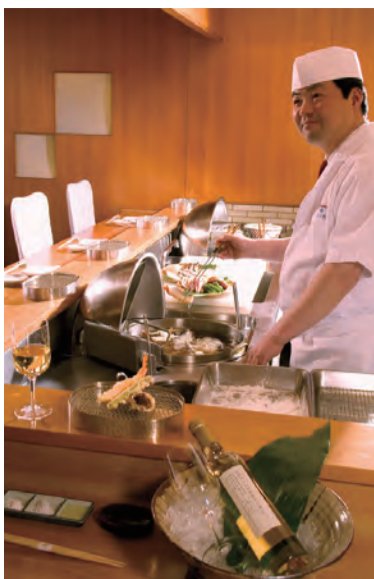
日本料理「都」の天ぷらカウンター

都ホテル大阪は近鉄上本町駅に直結した上町台地の中心にあるランドマークホテル。ちよつとぜいたくにホテルでの昼食をお薦めです。揚げたて天ぷらコースを楽しんでみませんか。3階日本料理「都」の平日限定・お昼のメニューがおすすめです。