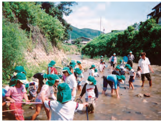
都会では体験できない川遊び

対象は満4歳から小学生。参加費は一般2万2050円(めばえ特製帽子2100円含む)。申し込みは7月9日まで、定員になり次第締め切り。問い合わせは同学園大阪本部教室まで。