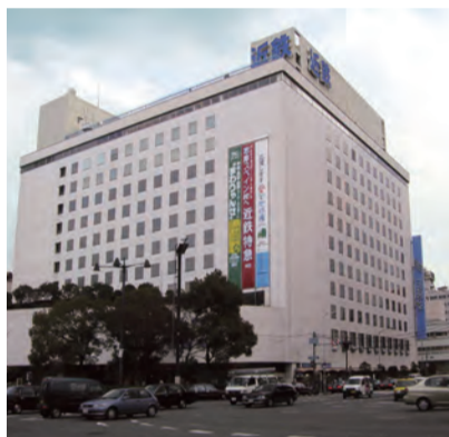
近鉄百貨店上本町店

〒543-0028 天王寺区小橋町2-12 森田ビル2F 関西進学セミナー 上本町教室