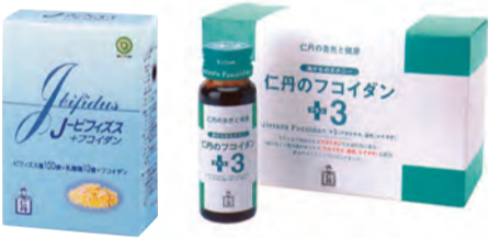
J-ビフィズス+フコイダン(左)は仁丹の技術でビフィズス菌とフコイダンを腸に届けます

仁丹フコイダン（中央区玉造1-1-30、フリーダイヤル0120-27-2126）は、モスク・昆布・ワカメ・ヒジキなどの海藻類だけが持っている多糖成分「フコイダン」を