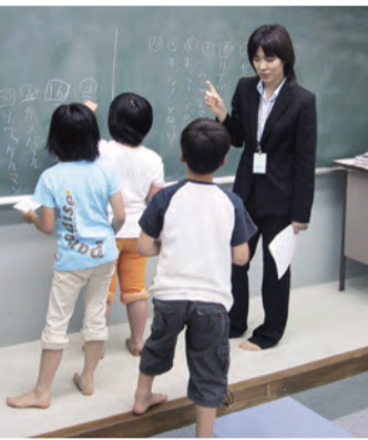
楽しく積極的な子どもたちの様子

同学園では子どもたちに実体験を通して真の力を育てる場「元気っ子」を開催し、通年活動を行っています。乗馬、田畑体験、川・雪遊びほか