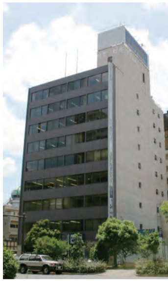
松下介護学館のある松下ビル

松下介護学館では、ホームヘルパー2級の資格を取得できる養成講座をはじめ、多彩な講座を開講しています。 少子高齢化の進む現在の社会、介護の現場は人材の不足が深刻な問題になりつつあり、介護に携わる人の育成と確保が重要な課題になっていくことが可能です。 同館のホームヘルパー2級課程養成講座は、1カ月で修了する昼間・速習コースと、4カ月で修了の夜間コースがあり、自分の生活スタイルや都合に合わせて通学、学習することが可能です。 講座修了者には、会報の発行や同窓会の開催、