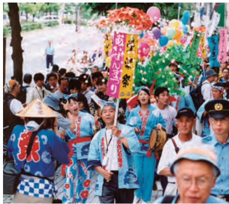
愛染祭(上) 夏越しの祓えの大法要(下)

大阪の夏祭り一番乗り「愛染祭」が6月30日(7月2日、西国愛染霊場)で開催される。場第1番札所、勝鬘院愛染堂(天王寺区夕陽丘町、奥田聖応住職)で開催さ