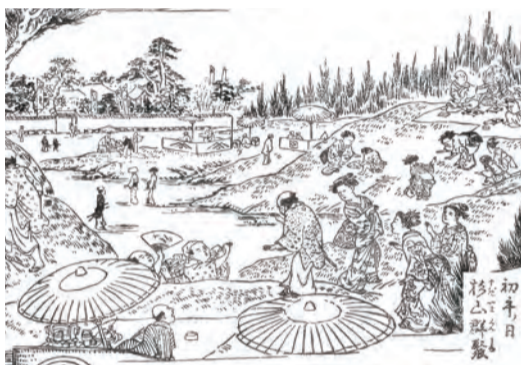
摂津名所図会 巻三 杉山群聚 (部分)

上町台地の北の突端にあるのは、皆さんご存じの大阪城公園。野鳥が集い、春には梅や桜、秋には紅葉が私たちの目を楽しませてくれる、都会の中の貴重な自然空間です。もともと、お城へは豊臣秀吉の時代から江戸時代、そして昭和の初めまでは自由に立ち入ることはできませんでした。ところが、東南隅にあった算用曲輪(森之宮から大阪城公園に入って玉造口に近い辺り)は、江戸時代には「杉山」と呼ばれた丘で、春になると多く