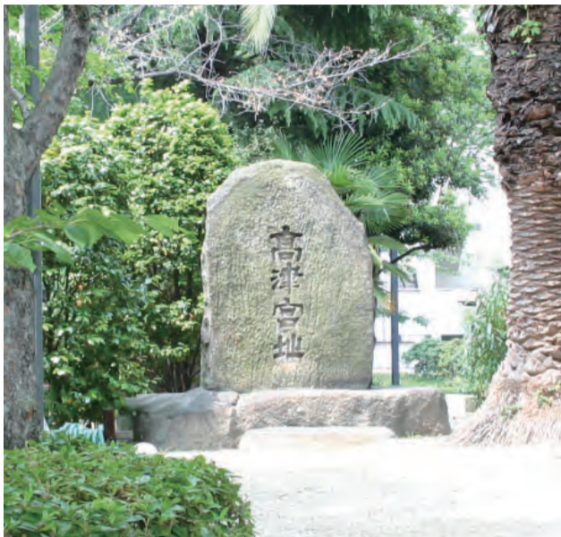
大阪府立高津高等学校にある「高津宮址」碑(上)と自由な服装で元気いっぱいの生徒たち(右) 校是「自由と創造」碑(下)