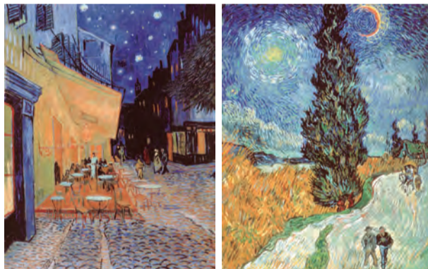
ゴッホ展に展示中の名作「系杉と星の見える道」(右)と「夜のカフェテラス」(左)2点ともクレラー=ミュラー美術館所蔵

世界中の人々に最も愛されてきた画家の一人で、狂気の画家といったイメージで語られることもあるフィンセント・ファン・ゴッホ。今回のゴッホ展では暗い色彩による写実的な初期の絵画から、ま