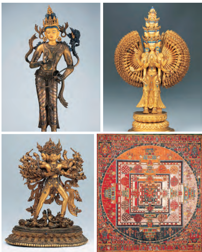
十一面千手千眼観音菩薩立像(ノンプリンカ蔵・右上)、弥勒菩薩立像(ポタラ宮蔵・左上)、カーラチャクラマンダラ・タンカ(ノルプリンカ蔵・右下)、カーラチャクラ父母仏立像(シャル寺蔵・左下)

大阪歴史博物館は1月23日「宝」を開催します。世界的に注目されているチベットの歴史や文化を紹介する、日本初中国チベット文化保護発展協会の協賛で開催します。世界的に注目を集めているチベットの歴史や文化を紹介する、日本初中国チベット文化保護発展協会の協賛で開催します。