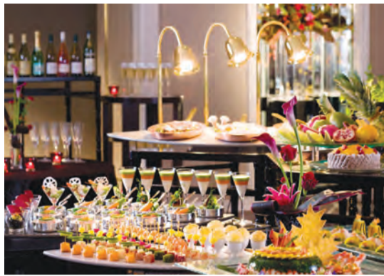
ニューイヤーズバイキング（イメージ）

ランチは午前11時～午後2時（最終入場午後1時30分）、男性6,500円、女性6,000円、小学生3,000円、4歳—小学生未満1,000円。ティナーは午後5時30分—9時（最終入場午後8時30分）、男性8,000円、女性7,500円、小学生4,000円、4歳—小学生未満1,200円。ソフトドリンクは飲み放題。前日までに