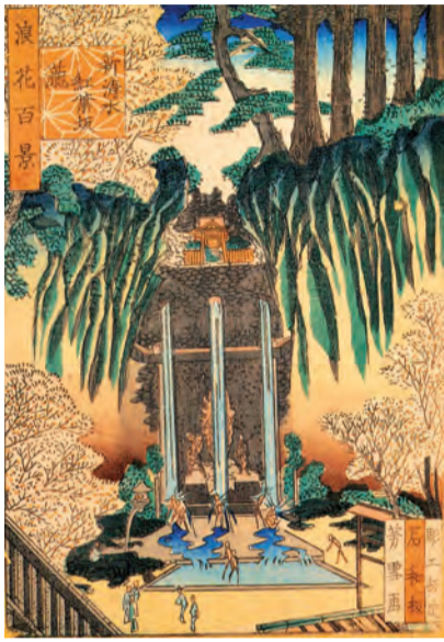
「浪花百景 新清水紅葉坂瀧」

あけましておめでとうございませう。本年も『うえまち』をよろしくお願ひ申し上げます。 さて、NPO法人まち・すまいづくりでは、多種の事業を展開しています。その一つが住宅建築に関するコンサルティング。大阪府リフォームマスター登録団体として皆さまの住宅に関するさまざまな悩みや相談に当法人会員の1級建築士がお応えします。特に耐震診断から改修に関する『うえまち』紙面でも専門家の協力により、地震のメカニズムや被害について情報発信するなど、皆さまに関心を持っていただくよう声を上げてまいりました。 (まち・すまいづくり)