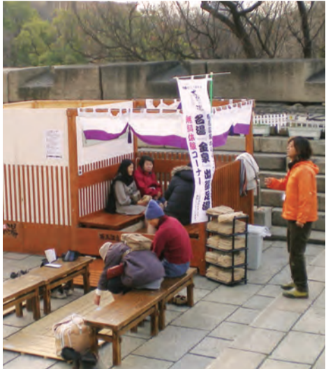
現在の復興天守閣に飾ってあるトラのレリーフ「伏虎」(上)と、有馬温泉「太閤の湯」の足湯(下)