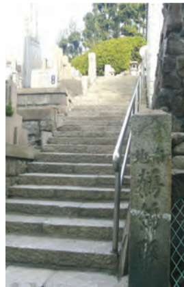
清水寺の境内に残る「鶴鴿坂」の標石

今回取り上げる坂は紅葉坂。すでに紅葉のシーズンは過ぎ、紹介の時機を失してしまつたかのように、実はこの坂、それ自体は今でもありませんが、紅葉の景観は全く見られなくなつており、その名はほとんど忘れられたものとなつてしまいました。 紅葉坂は天王寺区俗人町所在の新清水寺(清光院)の境内にある坂です。新清水寺は江戸時代、寛永17年(1640年)創建といわれていますが、四天王寺に伝わる記録によれば遅くとも16世紀には存在しており、在栖河寺(ありすがわでら)と呼ばれていました。京都の清水寺から本尊を移したことから新清水寺と称したといわれていますが、上町台地の西斜面に張り出す懸け造りの姿もまた清水寺とそっくりでした。その特徴的な景観は大阪を代表する名所の一つとしてよく知られていました。 新清水寺は斜面を利用しながら境内を造つていたため、低い西側へ下りていくためには階段を設ける必要がありました。かつてその階段(坂)は3つあり、その1つが紅葉坂でした。現在、台地上の同寺墓域から水垢離(みずごり)で知られた玉出の滝へ下りていく石段があります。これが紅葉坂と呼ばれた坂です。 江戸時代の書物をひも解いてみましょう。幕末の大阪を詳しく紹介した『撰津南所図会大成』には「本堂の南の傍