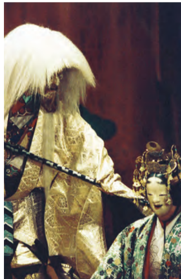
能「恋重荷」の一場面

「そも恋はなにの、重にぞ」もお楽しみに。一般前売り4,200円、学生2,600円、当日一般4,700円、学生3,000円。プラス500円で座席指定が可能です(要予約)。