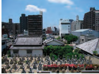
グラウンドの西・アクセス路から見た西側の風景

〈高口長老〉大江神社から家隆塚の間に広がる眺望は、どのように読み解くことができますか。