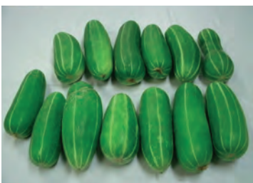
中央区発祥の伝統野菜「玉造黒門越瓜」

中央区役所では、中央区発祥のなにわの伝統野菜「玉造黒門越瓜(たまつくりくわ)もんしろ(うり)」の種を配布しています。歴史のある伝統野菜を育て、料理に用いるなどとして身近に感じてもらうと企画。区内在住・在勤者を対象に、保健福祉センターで5月31日まで配布しています(先着100人)。 ▽中央区役所保健福祉課(運営) 〓中央区久太郎町1-2-27、電話06・6267・0882