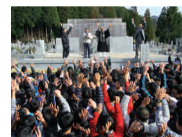
100km完歩の達成感を込めて万歳三唱

完了。完全証明書を手にした生徒は、あの100kmが歩けたのだからと幾多の困難も、粘り強く乗り越えていってこれると確信しています。また、凶らずもリタイアした生徒は、来年リベンジし、悔しさの涙を喜びの涙にして、すんなり行けた生徒以上に、でっかい達成感を味わってほしいと思っています。いずれにしても、100km歩行を通してたくましさを増し、感謝の心を培って成長していかれることが、うれしいです。