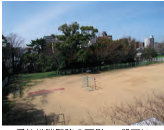
愛染堂勝鬘院の西側、一段下に広がるグラウンド