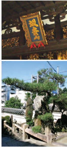
「摂津名所図会」一心寺（左）と坂叡山の額（右上）、駒つなぎの松（右下）