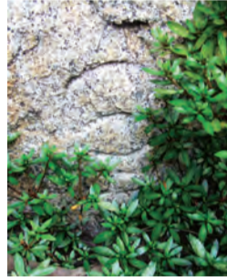
龍造寺町に保存されている石垣石

今年、現在の大阪城天守閣の建物が完成して80周年に当たります。今、わたしたちが目にする大阪城は基本的に徳川時代に築造されたもので、天守閣は寛文6年(1666年)の落雷で焼失した後江戸時代に再建されることはなく、昭和6年(1931年)に復興されたというわけです。現在の大阪城の魅力の一つに高く美しい反りを持つ石垣積みがあります。また、石垣石自体も巨大なものが少なくなく見る人を驚かせますし、全体で使用されている石は何と100万個にも達するといわれています。これらの石のほとんどは花こう岩で、産地は東六甲(兵庫