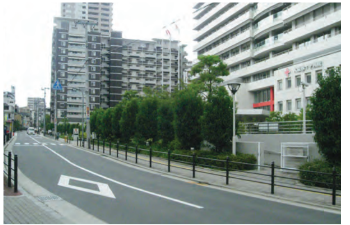
大阪赤十字病院前の「筆ヶ坂」

8月中、1日無料体験会を開催します。空手は月曜日午後5時～6時の1時間、ダンスは火・水・木曜日午後5～6時の1時間。9月からは本科生に交さっての無料体験となります。