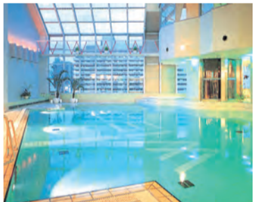
コス・パ上本町の屋内プール

の秋を楽しんでみては。▽コス・パ上本町天王寺区上本町3-8-6(地下鉄谷町9丁目駅、近鉄上本町駅から徒歩3分)、電話06-6771-3411、9月30日まで休まず営業