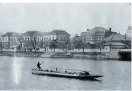
明治年間の堂島川

大阪城天守閣 大阪城天守閣は「水都大阪2009」関連事業として8月22日～9月30日、古写真展「水都大阪の堀めぐり・川めぐり」を開催します。 大阪城天守閣が所蔵する明治時代―昭和初期を中心とした古写真の中から「水の都」