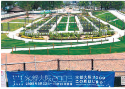
中之島公園の植栽工事

などを行います。同社には樹木医が2人在籍しており、これらの仕事に力を入れており、遊び心を加えて壁面を広告とした「テコラグリーン」(テコサイン壁面緑化)を取り入れ、環境に貢献する企業イメージアップや壁面を利用した収益向上策を提供。住宅向けにはポット樹木によるエコ緑化を提案、約30種ある特産樹木を販売しています。都会のマンションライフにポット樹木を使った手軽なペランダガーテニングをしてみませんか。