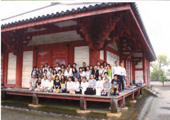
姫路城天守閣から見た姫路城下(上)、緑に囲まれた浄土寺(中)、国宝浄土堂での記念撮影(下)

当日はあいにくの雨天。猛暑を予想していた参加者の中には「雨の旅も一興」と和やかな声も。バス中で事前勉強(講義)を済ませ、雨にぬれた姫路城へ。夏休みの観光客らで少々混雑気味の中でも「大阪城とは違うなあ」と楽しく見学しました。