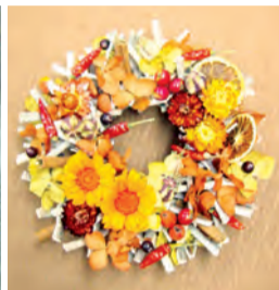
秋の情緒をデザインしたフラワーアレンジ

16日は「素材で遊ぶモチーフカラーのモダンアレンジ」。ピンク系のバラや洋ランをメインに、鳥の羽やさまざまな質感のリボン、パールなどのオーナメントをコーディネートした、大人っぽいモダンな作品です。29日はプリザーブドフラワーを使った「初秋のナチュラルリース」作り。サンセットアレンジやライトアップの花や実で、ひと足早く秋の情景をデザインします。