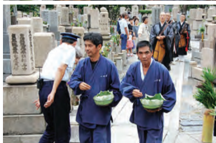
施餓鬼法要の一つ 墓施餓鬼(サンバラ会)の様子

ると、たちまちそれは火と変わり食べることができない。餓鬼は骨と皮ばかりにやせ衰え、限りなく飢えと渇きに苦しむといわれ、自分の力でその苦しみをから抜け出すすべはないといわれます。この餓鬼を救う唯一の方法が「施餓鬼法要」です。 「観音菩薩(ぼんざつ)より