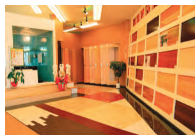
藤井寺店ショールーム内