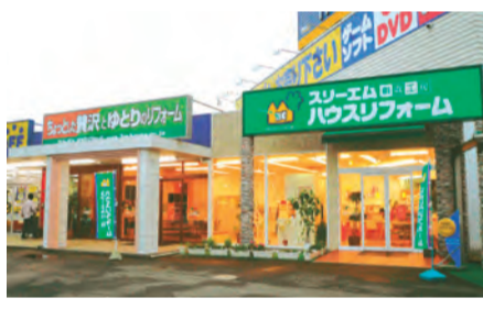
スリーエムハウスリフォーム藤井寺

紳士服、メガネ、金券ショップなどさまざまな分野で事業を展開するスリーエムグループのハウスリフォーム部門、スリーエムハウスリフォームは安心・安全をモットーに、適正価格の重視と地域密着型にこだわったサービスを追求。小さな工事も誠意を持って対応しています。工事件数は9000