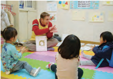
プロスキッツ教室

3歳から80歳を対象に1983年創立された英語学校、プロスランゲージセンターでは、言葉の基本「コミュニケーション力」を「読む力」「文法力」でサポートする教育法を実践しています。2歳からの英語プレスクール「プロスキッツ」では、楽しみながら国際マナーと自主性を育て、読む習慣を身に付けるズーフォニックスなど多彩な活動を取り入れ、成長するにつれて必要になる言葉の基礎力を養います。ほかに幼稚園から小学生を対象にしたレベル別子ども英