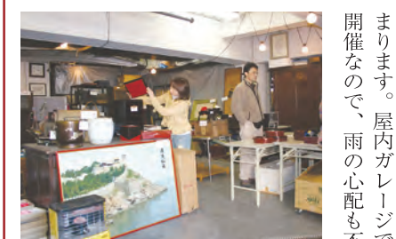
フリーマーケット会場の様子

で、最も史跡の多い地区でもあり、密集する寺院群には文楽や落語の芸人、漢学者、儒学者、大名、武士など無数の有名な墓や由緒が眠っています。