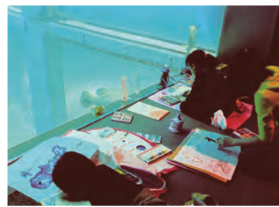
海遊館での写生会

たいとの願いからオープンしました。美大、芸大を目指す人の指導はもちろん、子どもコースでは子どもの集中力や根気、創造力を引き出す指導を行っています。一般コースや大人のデッサン教室もあり、年齢