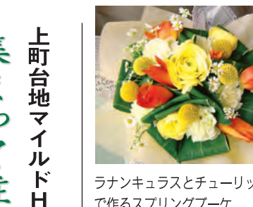
ランキュラスとチューリップで作るスプリングブーケ

上町台地のコーポラティブハウスに住む人や団地研究者を迎えて、第1部の落語で語られた風景と重ね合わせながら、これまで上町台地で営まれてきた、集まって住む姿のすまいるが参加する上町台地マイルドHOPEゾーン協議会のイベントとして行われるもの。午後1時30分開演。