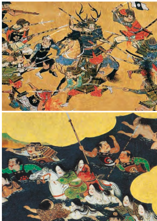
大坂夏の陣図屏風から、本多忠朝奮戦部分(上)と淀川付近での惨状(下)

大阪城天守閣は3月20日、開が誇る合戦図屏風コレクションを一挙に紹介し、その魅力に迫ります。戦国時代の合戦を描写した屏風絵からは、当時の戦の様相がうかがえます。 開催中の「戦国の情報戦」