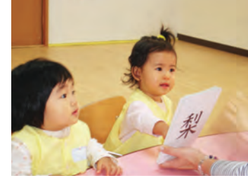
このものの園、ぎんのすずは、子どものあらゆる才能の基礎をつくる生後2カ月の乳児から5歳児を対象に、幸福な道へと子どもを育てるプログラムを実施しています。同園では本園に頭の良い子どもとは、的確な判断ができる・自己表現ができる・他人とのコミュニケーションがうまく取れる・新しいことに自発的に取り組めることなどが

星澄事務所 50周年迎える岩木星澄氏主宰 創作の楽しさ広がる書道教室 星澄(せいちょう)事務所では、国立文楽劇場の近松門左衛門の作品など有名な、来年5月に書家として50周年を迎える岩木星澄氏の下、「書は心で書く」をモットーに、幼稚園児から80歳を超える人まで幅広い年代の人が書道を楽しんで学んでいます。ペン習字や助手資格が取れる短期専門コース、絵手紙など多彩なコースを開講中。初めて筆を持つ人や、書に長年親しんできた人など、一人ひとりに合わせた丁寧な指導が好評です。 3月7・14・21日に無料体験を実施。4月末まで入会金が無料になります。今なら来年度開催する50周年記念の展覧会への出品に、間に合うとのこと。この機会に好きな言葉