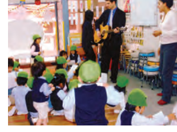
2歳～10歳児が幼稚園の代わりになる幼児教育の代わりになる国際部本科は、英語のほかにフランス語、日本語、リトミックのクラスがあり、最長午前8時から午後6時までの延長保育が可能。授業はネイティブスピーカーが担当し、育児面や精神面は経験豊富な幼稚園教諭兼保育士資格を持つ日本人教諭がサポートします。現在新年度生10人を募集しています。

めばえ幼児才能学園 有名私立幼稚園合同説明会を開催 09年度生募集、無料体験レッスン実施 天王寺区で20年、幼児教育の総合教室、めばえ幼児才能学園は参加無料の有名私立幼稚園合同説明会を開催します。3月2日(土)10時から、近畿大学附属幼稚園、城星学園幼稚園、帝塚山学院幼稚園、帝塚山幼稚園(奈良)の園長らが各園の特徴を説明します。受験を予定している人はもちろん、子育てのヒントを求めている人にも有益な内容です。当日は無料で一時保育を利用できます。(満2歳以上)。一時保育中にミニレッスンを実施します。 同園は現在2009年度生を募集。2月26日に無料体験レッスンを実施します。対象は0歳児から小学生。文字・数・図形遊び、知恵の取