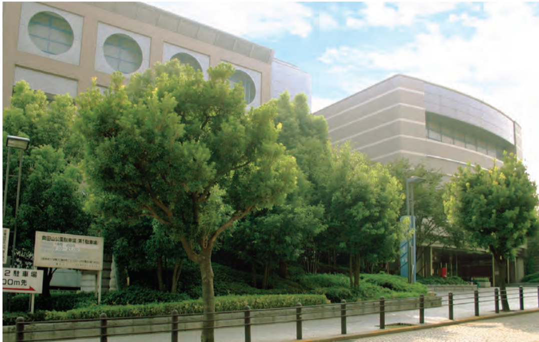
大阪市立天王寺スポーツセンター・真田山プールは大阪城の歴史に由縁の深い、真田山公園にある運動施設。多目的のアリーナ、屋内プール、トレーニングルームのほか、屋外では夏はプール、冬はスケートリンクが設備され、さまざまなイベントや市民のレジャー、健康維持に利用されています

NPO法人まち・すまいづくりとアトリエ・ホロニカが協働するコーポラティブハウスのプロジェクトがいよいよ始動します。本紙6面に特別広報を掲載。