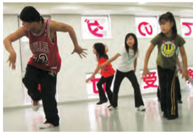
ストリートダンスのレッスン

プログラムのほかには幼児教育専門校のノウハウが活かされています。英語を話すことだけが目的ではなく、将来国際的に活躍するための人格教育に取り組んでいます。英語教育の重要性が高まる中、幼児期から英語に触れることで英語習得の基礎づくりを目指します。