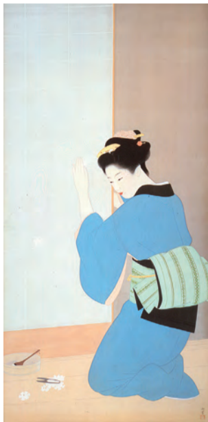
上村松園「晩秋」昭和18年(1943) 大阪市立美術館蔵 (住友コレクション) 展示期間11月28日〜12月24日