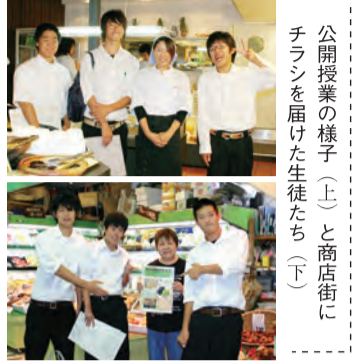
公開授業の様子(上)と商店街にチラシを届けた生徒たち(下)