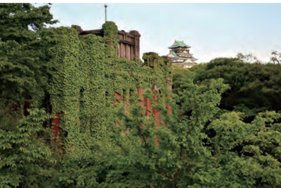
建築史的な価値もある化学分析場

※名所図会(ずえ)とは名所の来歴などを絵も交え紹介したもの。 ※「うえまちweb」(https://uemachiweb.com/)連載の「上町台地」名所図会」より、みなさまからの反響が大きかったものを、本号外でも掲載いたします。