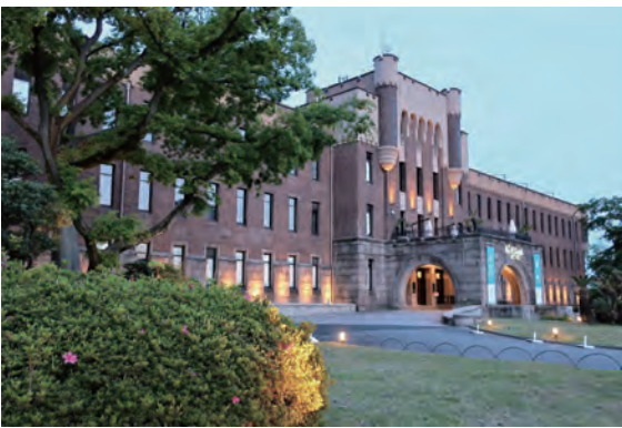
かつての師団司令部は市の寄付でつくられた

※名所図会(ずえ)とは名所の来歴などを絵も交え紹介したもの。 ※「うえまちweb」(https://uemachiweb.com/)連載の「上町台地」名所図会」より、みなさまからの反響が大きかったものを、本号外でも掲載いたします。