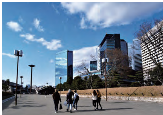
OBPも砲兵工廠跡につくられた

ネオルネッサンス風の建物である化学分析場は1919(大正8)年に完成。奇跡的に被害を免れ、戦後は阪大や自衛隊の施設として使われていたものの、いまはご覧のとおり未利用です(かつて日経大阪本社ビルがあった場所のすぐ東にあります)。実は、40年近く前までは本館と呼ばれる建物も天守閣の東に残っていました。残念ながら解体され、跡地にできたのが大阪城ホールです。戦争の記憶を風化させないために、真田山陸軍墓地同様、化学分析場もどう活用すべきかを考える時が来ているように思います。