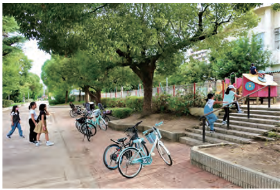
真田山公園も騎兵連隊跡で重要拠点だった

地下1階、地上3階の鉄筋コンクリートづくりで、1931(昭和6)年に完成。ヨーロッパの城を参考に設計されたといわれます。奇跡的に空襲にはあわず、戦後は警察の本部や市立博物館として利用されてきました。再び大阪が軍都と呼ばれるようになってはいけません。そのためにいっまでも残したい、「歴史の生き証人」です。